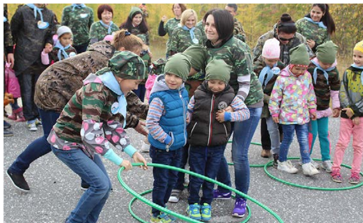
Туристам по плечу любые испытания

В финале участники турслета устроили привал, где подвели итоги путешествия, составили карту округа, пели, танцевали и угощались горячим чаем и пирогами с северными ягодами.