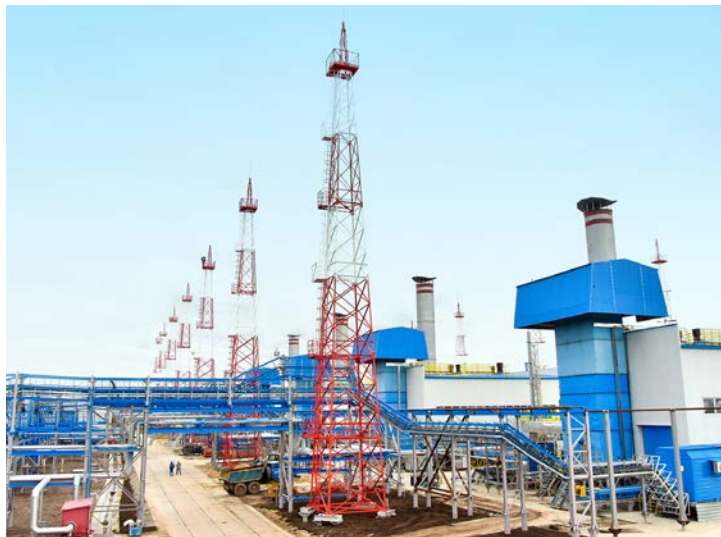
ДКС-16 станет важным звеном в цепочке добычи и подготовки газа

Возводящийся на Песцовой площади дожимной комплекс в перспективе станет одним из самых крупных в Обществе «Газпром добыча Уренгой»: проектом предусмотрены две ступени ДКС и, в общей сложности, 14 газоперекачивающих агрегатов. И все для того, чтобы в условиях постепенно снижающегося пластового давления объем добычи голубого топлива поддерживался промыслом на стабильном уровне – сегодня это около 30 миллиардов кубометров в год.