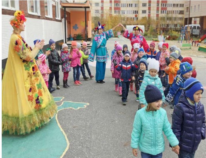
На любимом осеннем празднике

Наступила осень! Золотая пора преподносит воспитанникам детского сада «Княженика» Управления дошкольных подразделений много новых развлечений и интересных занятий. Уже в первые дни осени в детском саду начинаются тематические праздники. Заботливые и любящие свое дело воспитатели стараются всесторонне разнообразить детский досуг и стимулировать ребят к получению новых знаний.