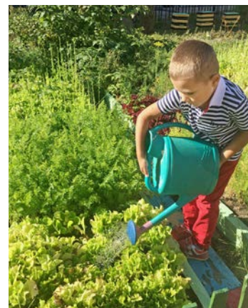
Во саду ли, в огороде, в зоопарке у зверят...

Объявляется профессиональный отбор для формирования резерва кадров на должность ведущего специалиста по спорту аппарата при руководстве администрации ООО «Газпром добыча Уренгой».