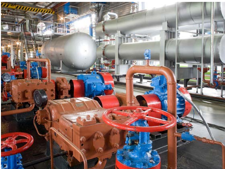
В производственном цехе промысла