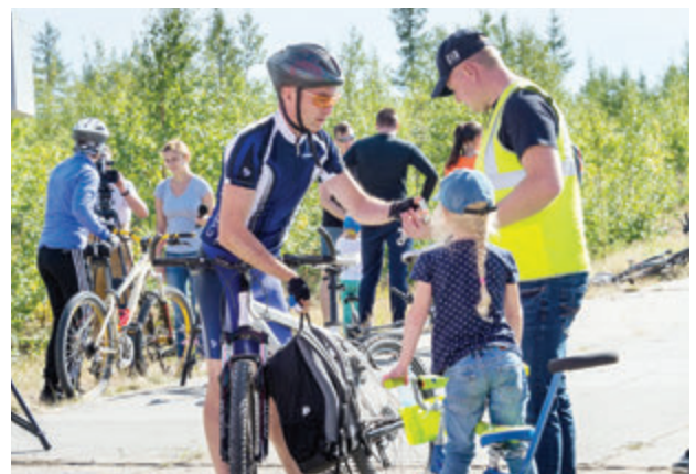
Velo Drag Racing — праздник для спортсменов опытных и начинающих