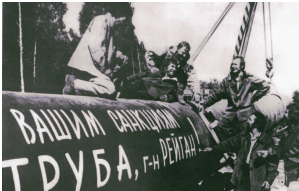
Мы помним, как все начиналось...

Обозначилась еще одна сложность: требовалось сагитировать коллектив поехать в Уренгой — практически на целину. Чтобы хоть немного обустроить быт, нужно было, в первую очередь, возводить жилье и школу. Построили два дома. Один — на восемь квартир — отдали