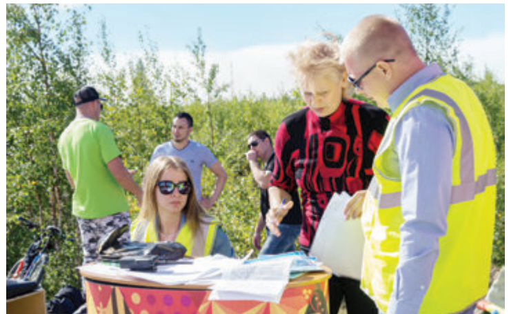
Первые подобные состязания — это испытание и для судей