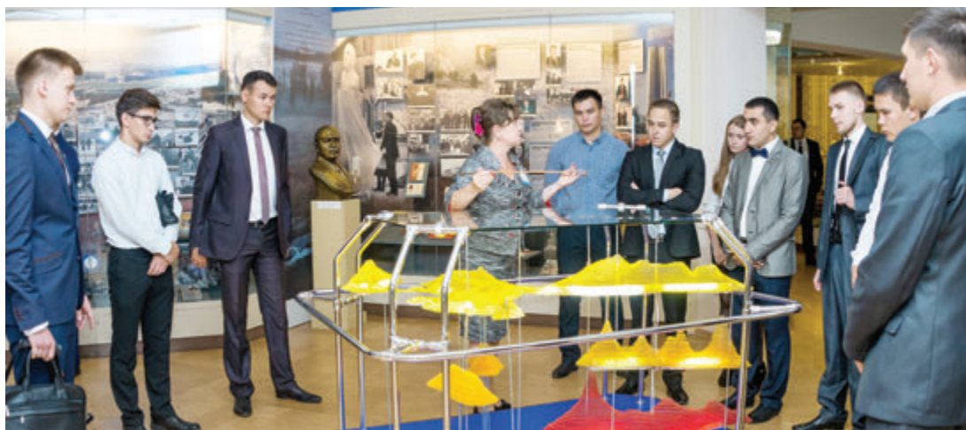
Знакомство с крупнейшим газодобывающим предприятием начинается по традиции с Музея истории Общества