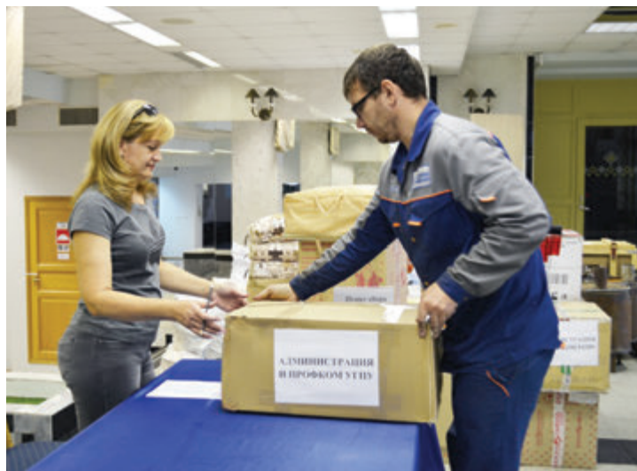
В пункте сбора гуманитарной помощи

К сегодняшнему дню из-за эпидемии сибирской язвы (в нашем регионе это первый случай