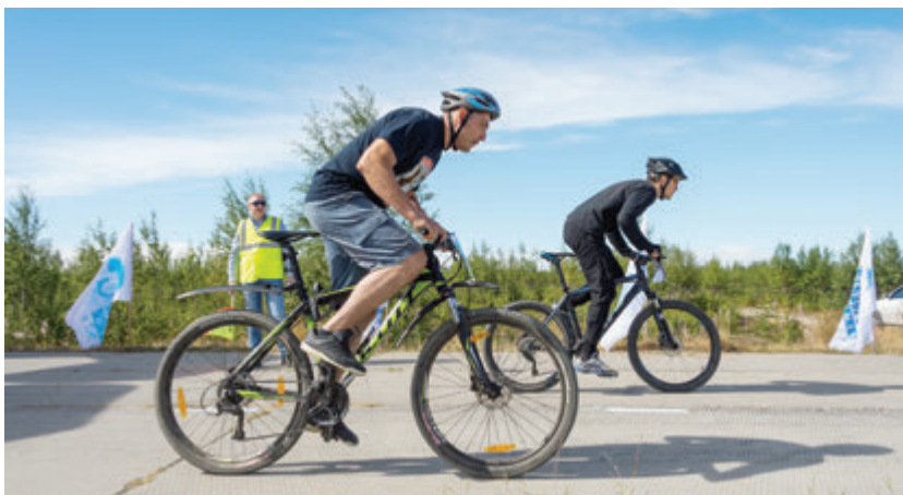
Реакция и «взрывная» сила — в таких гонках все решается на старте