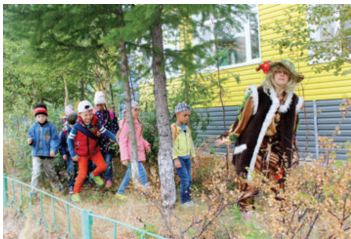
На «лесной» тропинке

Путешествуя по лесу, ребята встретили Бабу Ягу, которая была огорчена тем, что взрослые туристы оставили после себя на полянке очень много мусора. Малыши решили помочь и сами приступили к наведению порядка — с азартом и осознанием важно-