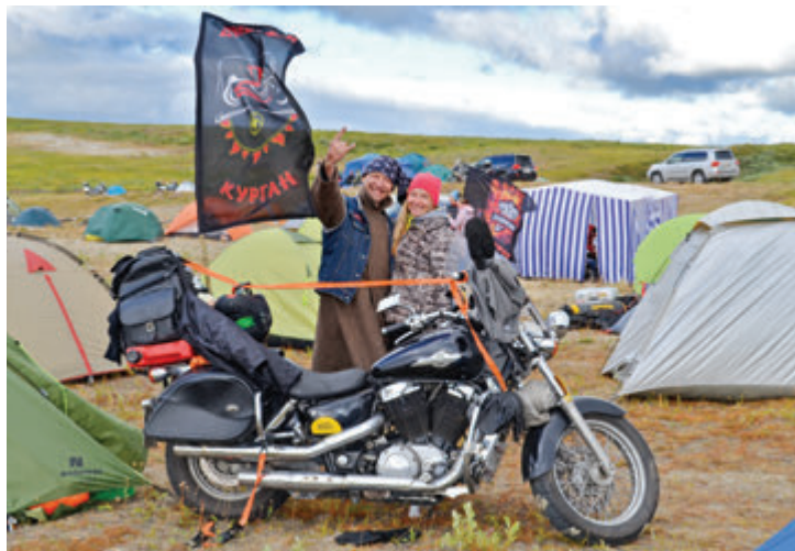
Гости из Кургана приветствуют вас!