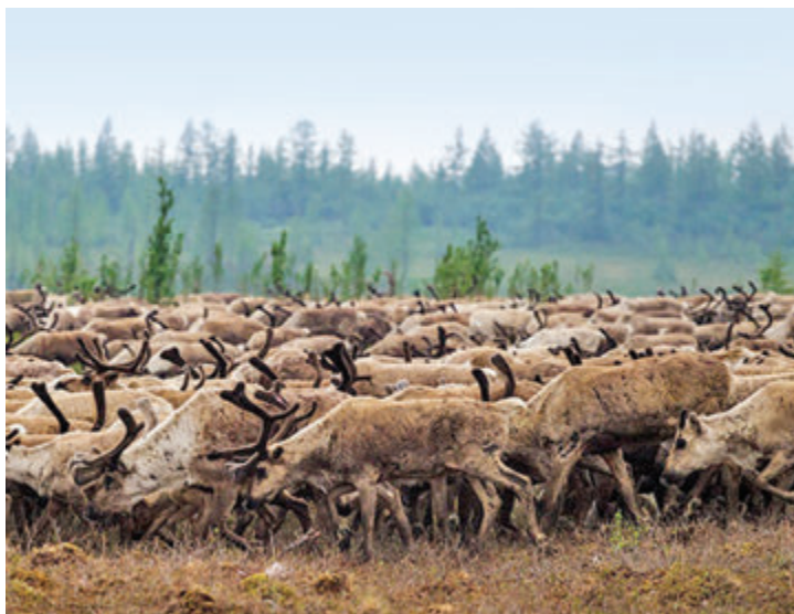
Для северных народов олень — и друг, и кормилец

Для нашего края это первый случай регистрации заболевания с 1941 года. Эпидемиологи и специалисты Роспотребнадзора склонны считать, что вспышка связана как раз с засушливым и необычайно теплым летом, из-за которого растаял заброшенный олений могильник. Дело в том, что возбудитель — бактерия Bacillus anthracis — сохраняется в почве десятилетиями и отличается крайне высокой устойчивостью к внешним воздействиям — ультрафиолетовому излучению, высокой и низкой температурам, дезинфицирующим средствам. Отмечается, что заболеванию сибирской язвы наиболее подвержены животные — обычно крупный и мелкий рогатый скот, однако от них разные споры легко передаются человеку — через мясо, шкуру или шерсть. Поэтому эпидемии чаще всего носят «профессиональную окраску» — заражаются в первую очередь животноводы и представители смежных специальностей. Выделяют три формы антракса: при попадании спор на кожу, особенно имеющую ссадины и микротравмы — кожная (наиболее распространенный и наименее опасный вид