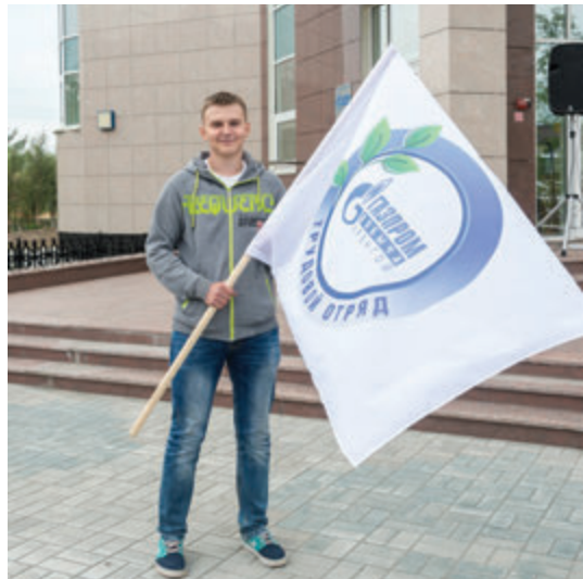
Под флагом «Трудового отряда»

— Ребята трудились в сложных условиях, при аномальной жаре и большой задымленности. Тем не менее, они отлично справились со своими обязанностями. Вторая смена «Экологического отряда» проделала большой объем полезной работы по облагораживанию территорий, ухаживая за зелеными насаждениями, убирая мусор.