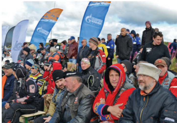
На открытии мотослета