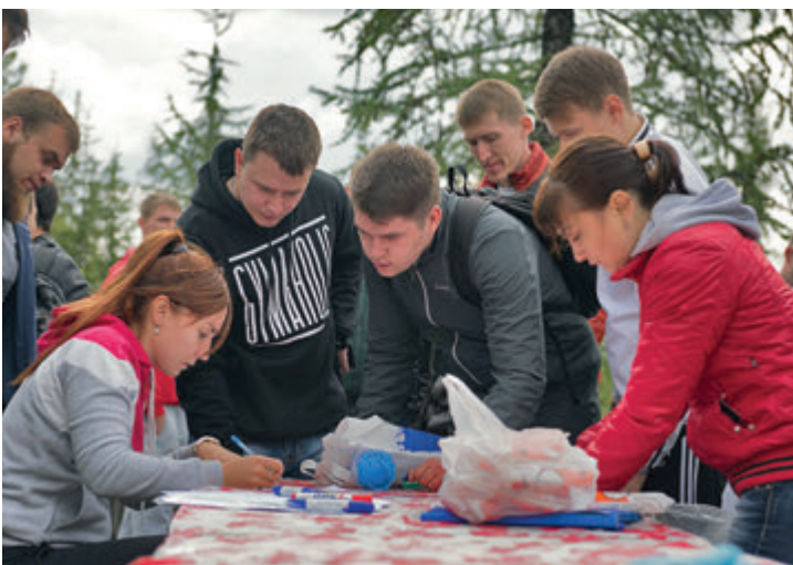
Познакомились, подружались, стали командой. Тренинг помог!

Служба по связям с общественностью и СМИ