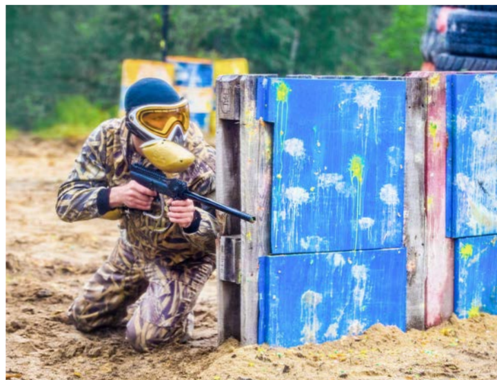
Во время боя каждый начеку

Впрочем, не менее насыщенным оказался и следующий день. В районе одного из офисных зданий Управления связи на специально оборудованной площадке прошли состязания по пейнтболу. Их организовали активисты Совета молодых ученых и специалистов газодобывающего предприятия. В соревнованиях приняли участие 16 команд из почти всех филиалов Общества, а это около сотни человек. Некоторые подразделения выставили даже по две команды. Приятно было видеть среди участников, облаченных в камуфляж и уверенно держащих в руках пейнтбольные маркеры, представительниц прекрасного пола. Соперникам предстояло разработать тактику «боя», постараться остаться «живыми», то есть незапятнанными краской, и захватить базу противника.