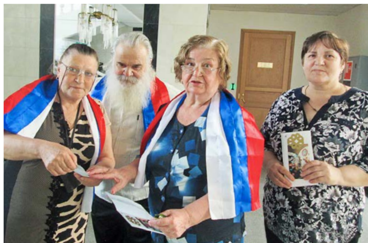
Квест — проверка на смекалку

В июне прошел квест «Наш дом», где две команды соревновались в скорости и сообразительности. Ко всеобщему удовольствию победила дружба, и все закончилось чаепитием с пирожными в кафе культурно-спортивного центра.