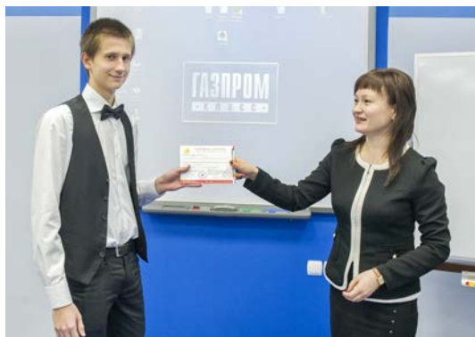
Школьные будни уже в прошлом. Впереди — взрослая жизнь