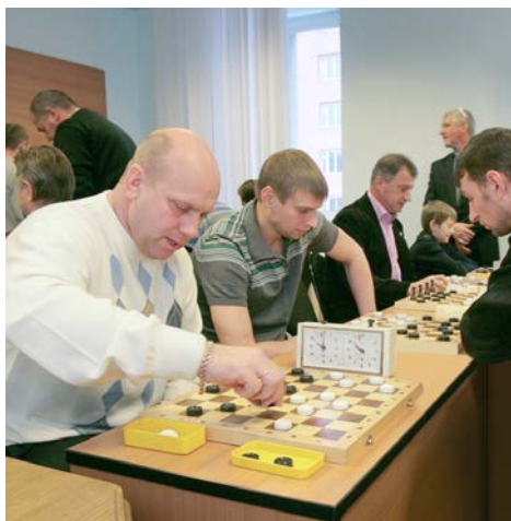
Мыслить логически и стратегически

Мероприятий много всегда! Вот уже второй год в Звездном зале «Газодобытчи-