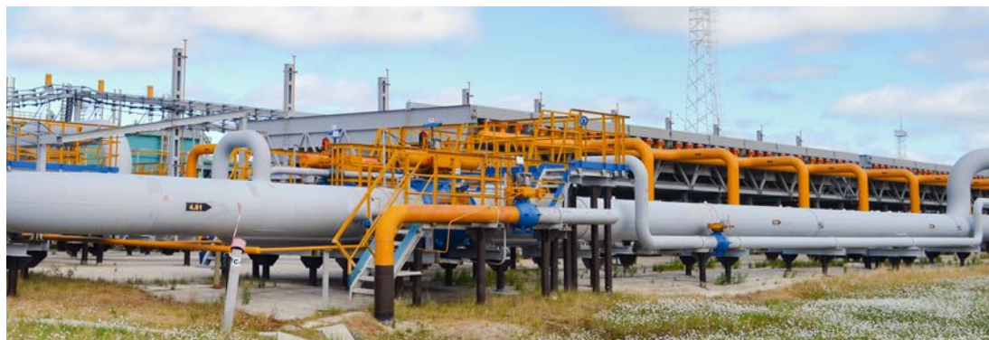
«Жемчужина Песцовой площади» — газовый промысел № 16