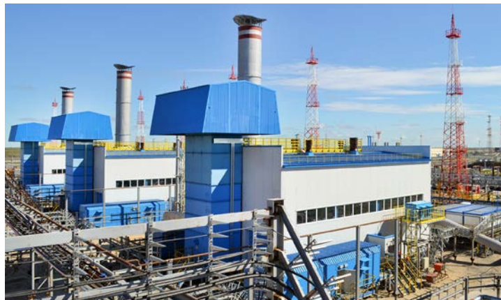
Газоперекачивающие агрегаты ДКС-16 готовятся к пуску в эксплуатацию уже в этом году

Для газодобытчиков ГП-16 подготовка рабочих площадок, разумеется, не единственная обязанность во время останова. Производственная «пауза» — лучшее время для подготовки промысла к надежной эксплуатации в осенне-зимний период, то есть для ежегодных плановых ревизий. Проверяется, ремонтируется и ревизируется все технологическое и энергетическое «железо» ГП-16, контрольно-измерительные приборы и автоматика. Особое внимание — тому оборудованию, которое невозможно снять во время эксплуатации промысла.