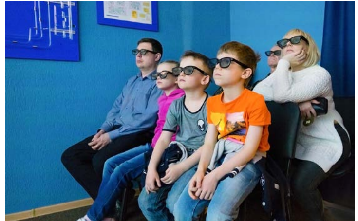
Во время просмотра 3D ролика об освоении ачимовских залежей