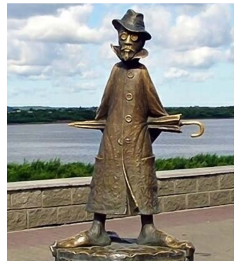
Бронзовый Чехов исполняет желания

Однако, на мой взгляд, сибирская провинция в более выигрышном свете предстает все