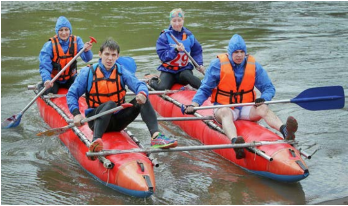
Сплав на катамаране — это возможность испытать себя, закалить характер и научиться работать в команде

В столице Татарстана вот уже в четвертый раз прошел Всероссийский весенний спортивно-туристический триал «Майский гром». На приглашение организаторов — Межрегиональной профсоюзной организации ОАО «Газпром» и Общества «Газпром трансгаз Казань» — принять участие в мероприятии в этом году откликнулись десять дочерних обществ ПАО «Газпром», в том числе и ООО «Газпром добыча Уренгой».