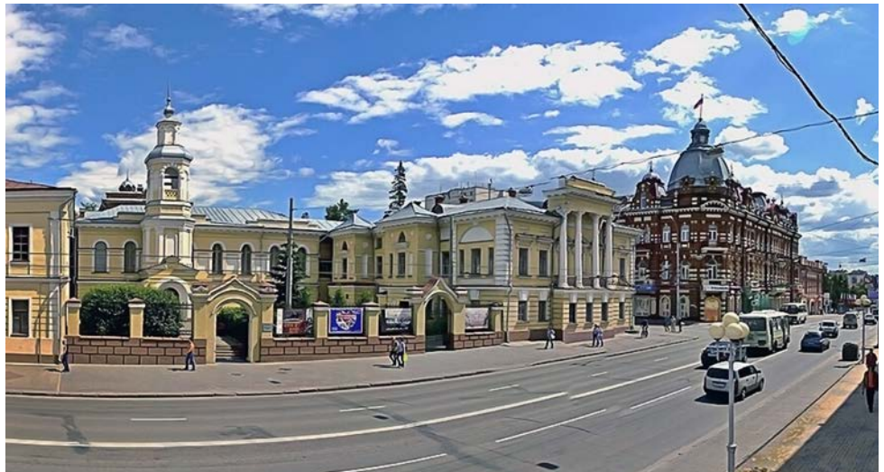
Исторический центр Томска

Желающие покупают путевки в санаторий, расположенный в окрестностях Томска, где можно не только поправить здоровье, но и по-