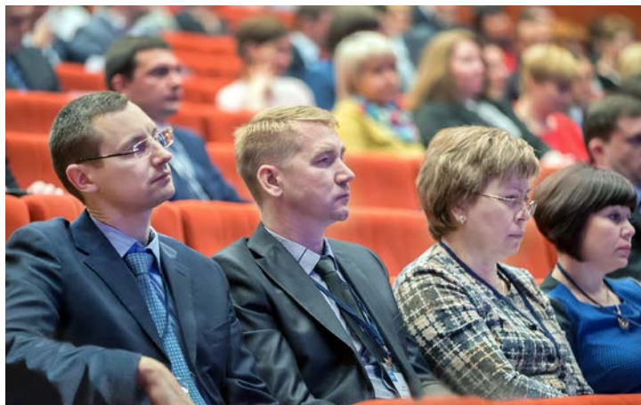
Участники конференции и внимательно слушали, и задавали вопросы выступающим