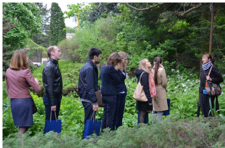
В Ботаническом саду Московского государственного университета

Около тридцати молодых специалистов из дочерних Обществ ПАО «Газпром» и нефтегазовых предприятий собрались в Музее земледелия Московского государственного университета имени М.В. Ломоносова, чтобы обсудить насущные вопросы. В научно-прак-