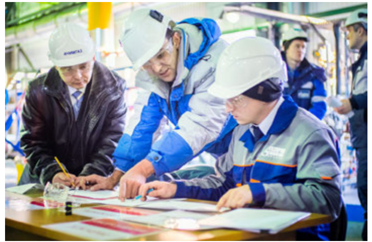
Беспристрастная комиссия подводит результаты конкурса профессионального мастерства

и трудится газодобытчиком уже шесть лет. Ему пришлось немало сил потратить на подготовку к столь серьезному событию. Тем не менее, стрессовая ситуация, волнение и ограничения во времени, по его мнению, помешали идеально справиться с заданием.