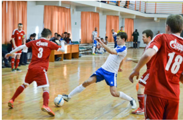
Жаркое северное дерби. «Газпром добыча Уренгой» — «Газпром добыча Надым»

Как бы это странно ни звучало, но дети играли в футбол сдержаннее взрослых, где матчи — чистые эмоции, подавлять которые не получалось ни у трибун, ни у тренеров, ни у самих спортсменов. Одним из ярких в плане накала страстей получился матч между сборной Общества «Газпром добыча Уренгой» и коллегами из ООО «Газпром добыча Надым». Голов было забито немного — всего два, и оба праздновали надымчане (увезшие впоследствии из Уфы серебряные награды), зато поединок изобилвал опасными моментами и красивыми комбинациями — тем, за что мини-футбол и любят миллионы болельщиков по всему миру. Соперники изрядно потрепали нервы друг другу,