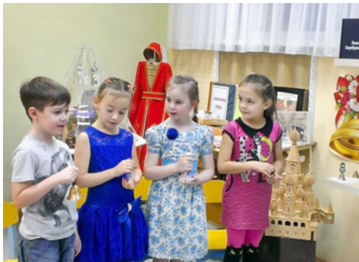
В музее детского сада «Снежинка»

«Изба» и «горница», «рушник» и «кокошник»... Как давно это было: на месте шумных городов стояли высокие терема и деревянные избы. Для наших детей те далекие времена кажутся небывалой историей, сказкой. Чтобы помочь малышам представить прошлое, коллективом и родителями детского сада «Снежинка» Управления дошкольных подразделений ООО «Газпром добыча Уренгой» несколько лет назад был создан мини-музей «Мультинациональная изба».