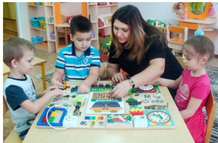
Бизборд — это увлекательно!