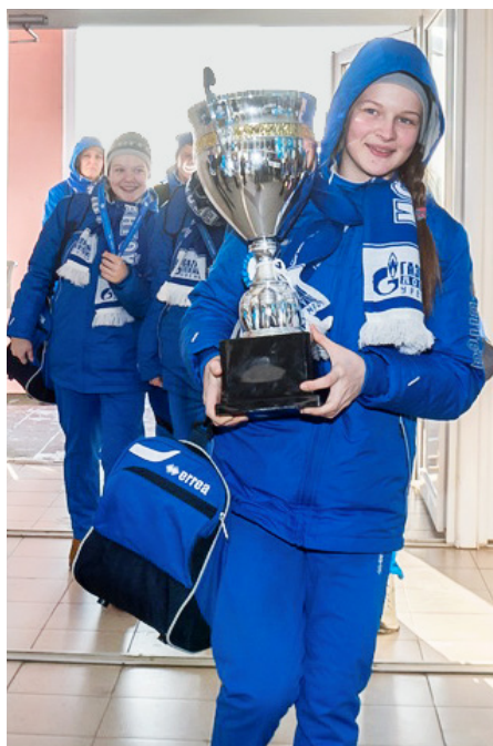
Девушки-волейболистки дошли до финала и вернулись с кубком