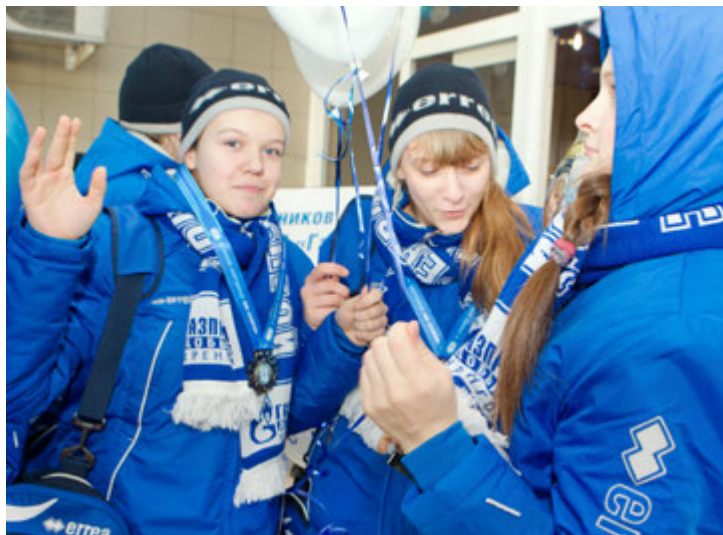
Обсуждать игры и делиться подробностями спортсмены будут еще долго...