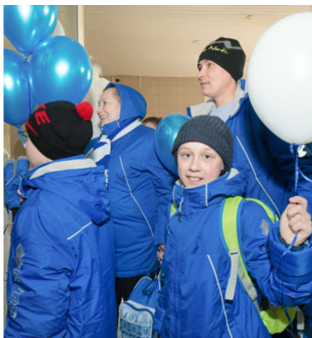
В гостях хорошо, а дома лучше! Улыбки на встрече — лучшее тому доказательство

Десятое место. С таким результатом вернулась из Башкортостана команда ООО «Газпром добыча Уренгой», представляющая предприятие на XI Зимней Спартакиаде ПАО «Газпром». Если же говорить только о добывающих компаниях публичного акционерного общества — то здесь наш коллектив показал лучший результат!