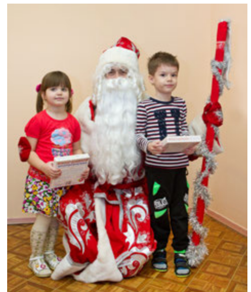
Дети в больнице не остались без внимания сказочного волшебника

И без того немалый перечень предновогодних профсоюзных мероприятий пополнился в этом году еще одним — благотворительной акцией. Газовики задумали поздравить с наступающим праздником детей, которые в силу обстоятельств будут встречать его в стационаре городской больницы. Дед Мороз пройдет по всем доступным для посещения отделениям, выслушает обязательные стихотворения и вручит наборы для детского творчества, ведь свободного времени для реализации художественных замыслов у ребят сейчас предостаточно. Подарки будут переданы и тем, кто находится в инфекционном отделении.