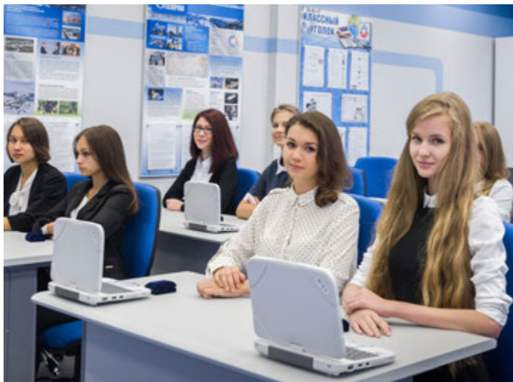
Учиться в «Газпром-классе» престижно!

Ирина СОРОКИНА и Елена МОИСЕЕВА