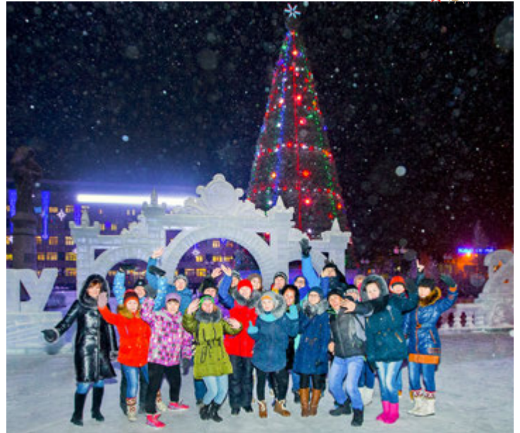
Заветная мечта — побывать в Новом Уренгое — сбылась

их ждала обширная программа. Прямо с вертолетной площадки юные гости отправились на экскурсию по цехам ГКП-22 Общества. Идея сориентировать ребят на получение профессии, связанной с добычей газа, сработала. Старшеклассники впечатлились современным производством, живо интересовались процессом добычи углеводородов из ачимовских горизонтов, задали много вопросов о социальной политике предприятия и о том, какие предметы надо изучать, чтобы стать газодобытчиком.