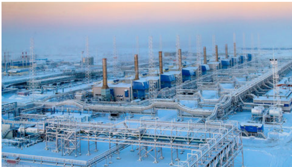
Развитие дожимного комплекса предприятия — важное направление деятельности. В этом году были запущены два компрессорных цеха на УКПГ-1АВ

Предприятием реализуется еще один социально значимый проект — «Будущее вместе». Программа нацелена на системную поддержку живущих в Новом Уренгее детей-сирот и детей, оставшихся без попечения родителей. Это особая категория ребят, которые, как никто другой, нуждаются в пра-