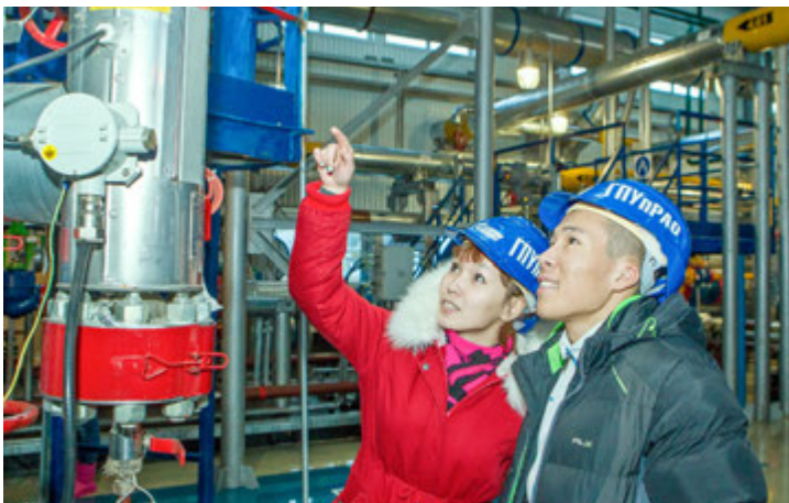
Увлекательная экскурсия на ГКП-22

Ирина РЕМЕС