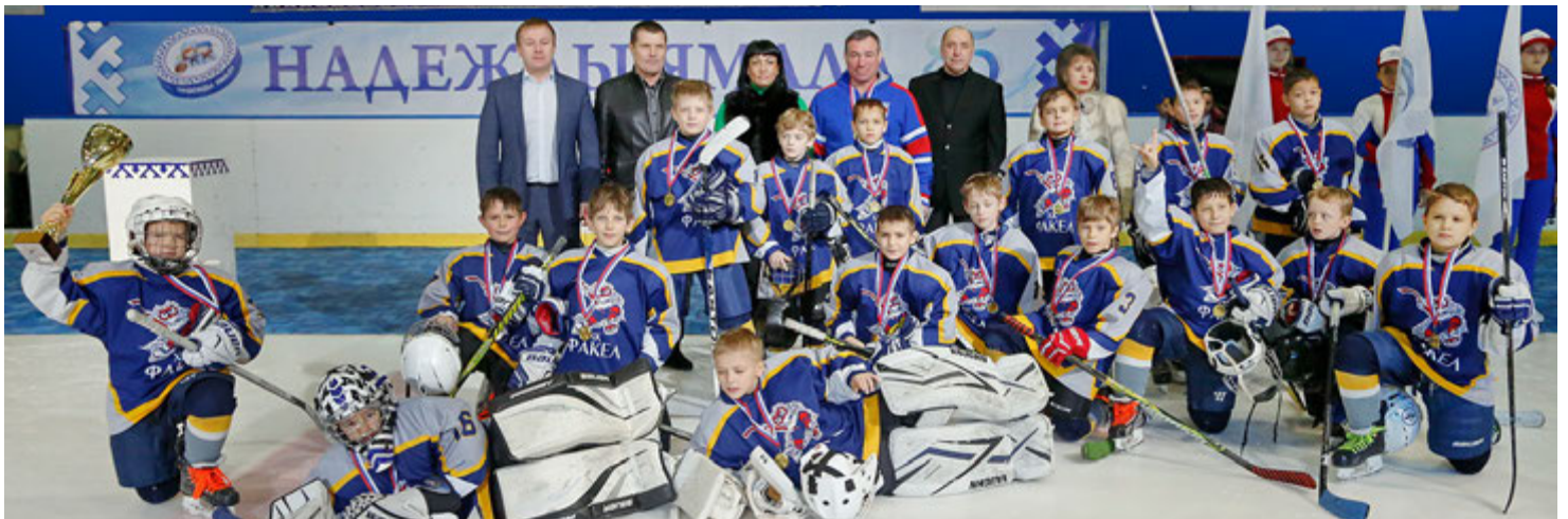
Новоуренгойский «Факел» — абсолютный победитель турнира!