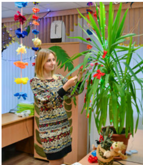
Тропический Новый год в офисе службы организации восстановления основных фондов

— На нашем счету уже три победы в этом конкурсе, — делится заместитель начальника