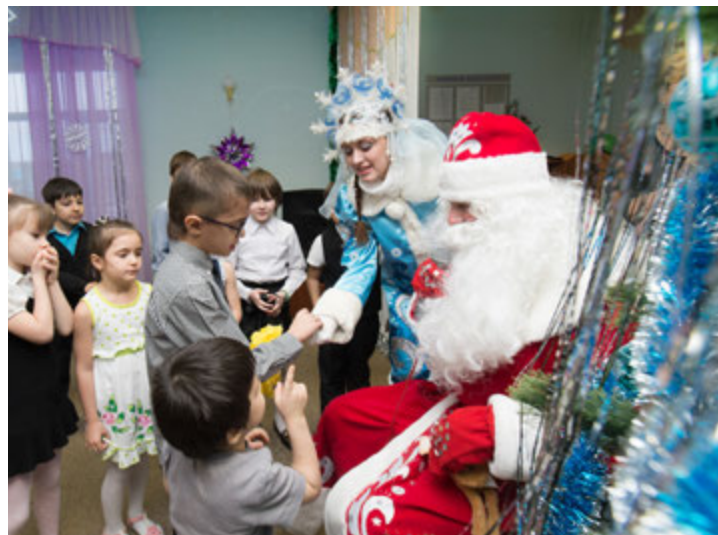
Праздник и подарки от газодобытчиков для ребят из школы «Поддержка»