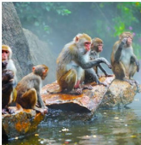
2016 год пройдет под покровительством Огненной обезьяны

Как и в предыдущих случаях, мама-Соношка младенцев только кормит, а все остальное время с ними занимается папа-Джоник. Старшая Марта уже подросла и теперь помогает отцу в уходе за малышами.