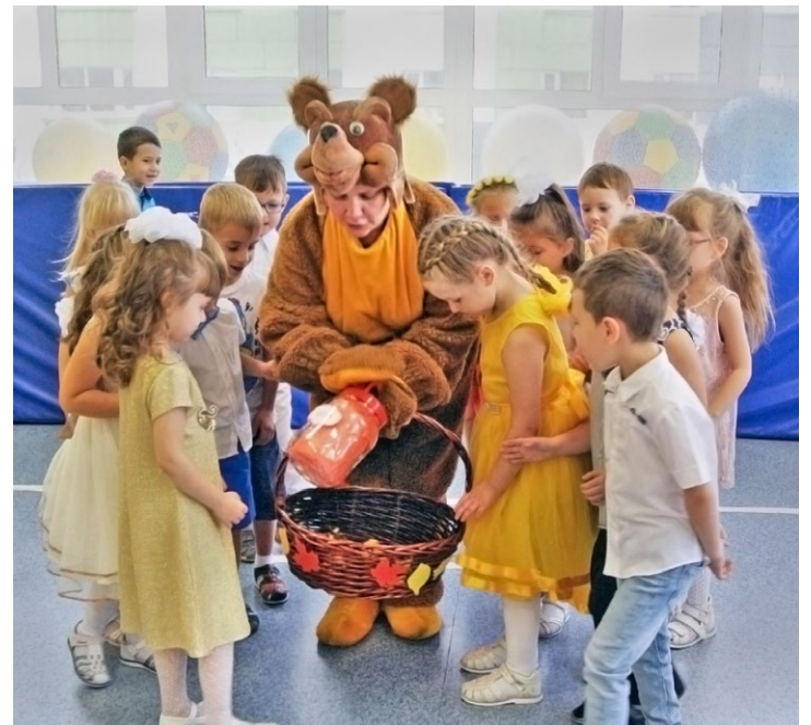
Сладкое осеннее угощение от Топтыги

После всех испытаний ребята вернулись в музыкальный зал с корзинами, полными по-