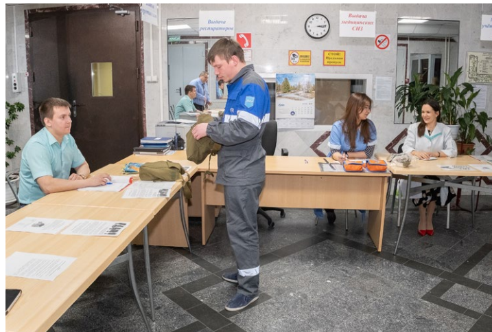
Пункт выдачи средств индивидуальной защиты

сооружений. Таковых в компании предусмотрено шестнадцать, они расположены в Уренгойском газопромышленном управлении и других наиболее крупных подразделениях. При таких обстоятельствах руководящий состав и средства связи переводятся на условно круглосуточное дежурство, а диспетчерские службы – на усиленный режим работы с увеличением числа задействованных в них сотрудников.