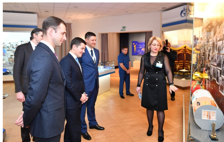
В Музее истории Общества «Газпром добыча Уренгой»