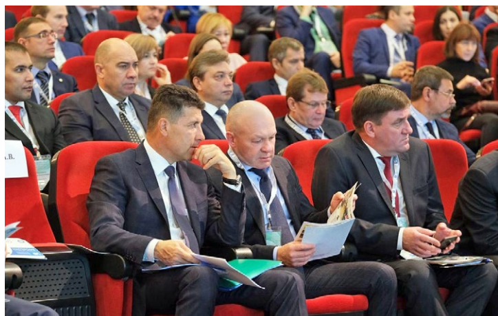
На заседании экспертного совета по природопользованию

Ключевыми в повестке дня стали темы реализации мероприятий, направленных на сохранение и восстановление природных ресурсов в процессе добычи, транспортировки и переработки углеводородного сырья на территории региона, и эффективного взаимодействия с компаниями ТЭК по актуальным вопросам социально-экономического развития округа.