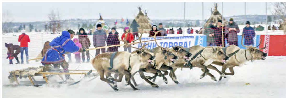
«Полярный ипподром» — главное событие праздника