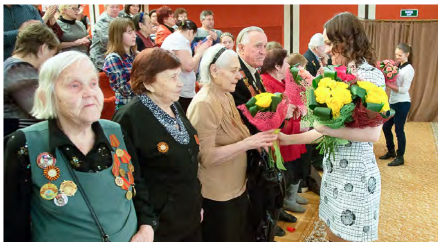
Цветы — почетным гостям фестиваля.