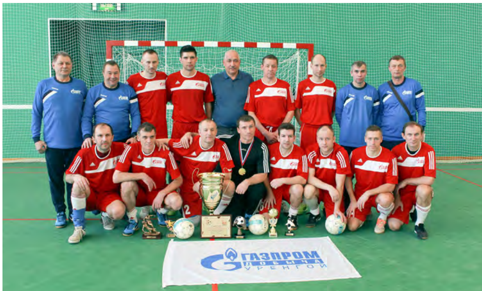
Команда ООО «Газпром добыча Уренгой» — 18-кратный чемпион Кубка ОАО «Газпром»