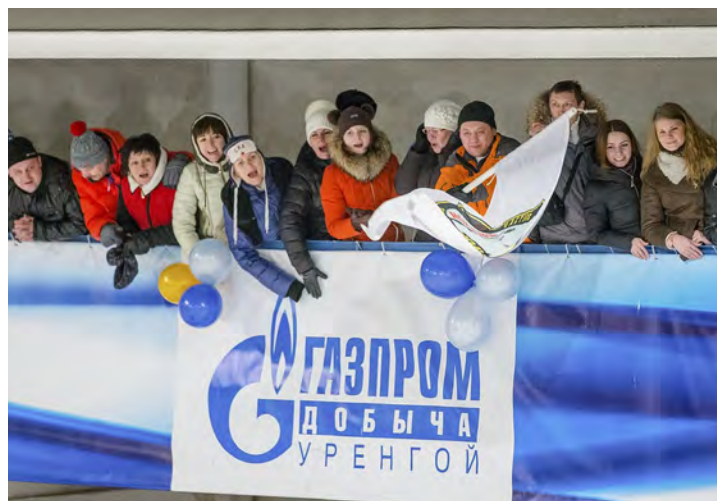
Поболеть за красивый хоккей пришло много болельщиков

— Спорт есть спорт. Здесь есть победители и проигравшие. Сегодня мы чувствуем победу, которые подарили нам яркую и красивую игру и которые посвятили свое чемпионство предстоящему великому празднику, за что им отдельная благодарность. Отмечу, что те, кто сегодня по-