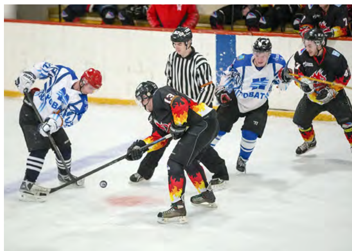
«Новатор» в итоге охладил пыл «Факела»

терпел поражение, смотрят в спину выигравшей команде — поэтому призываю чемпионов не зазнаваться и стремиться удержать первенство, достигнутое сегодня.