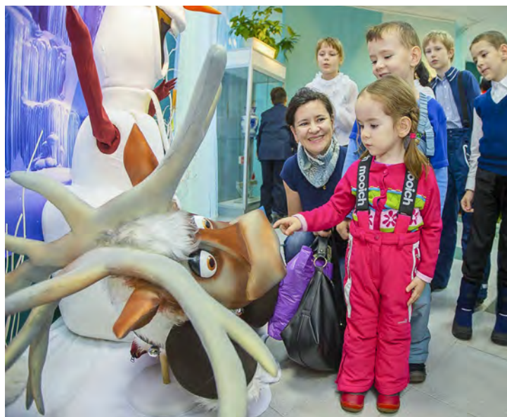
Дети — самые желанные гости фестиваля

Соб. инф.