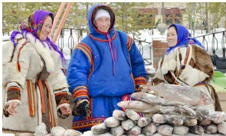
Гостеприимство и улыбки — неизменные атрибуты Дня оленевода

Елена ДАНИЛОВА