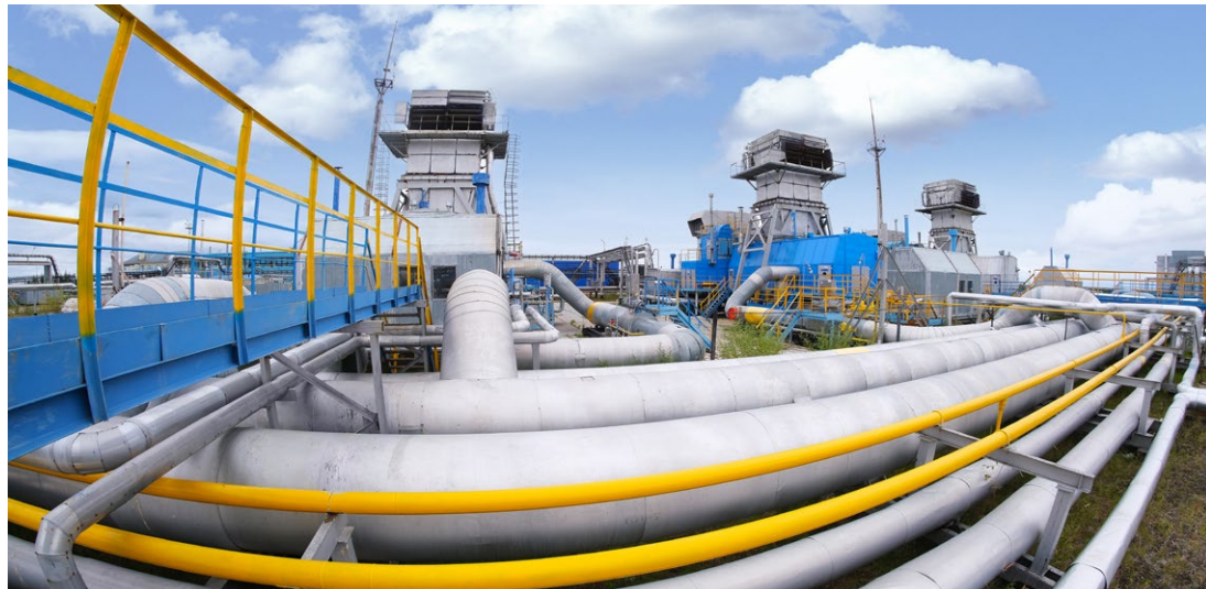
На газоконденсатном промысле № 2

Подготовила Елена МОИСЕЕВА