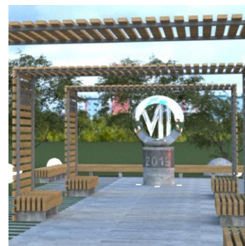
Проекты, представленные на конкурсе, – «Сердце Большого Уренгоя», «Никогда не останавливайся на достигнутом!» и «Аллея триллионов»