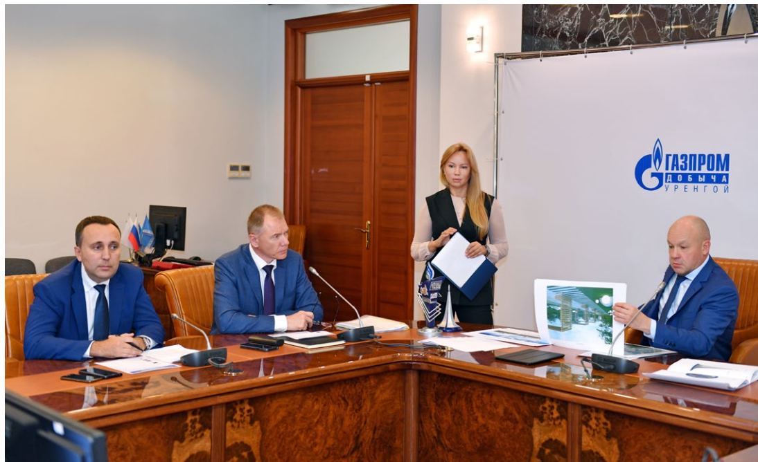
Конкурсной комиссии предстоит сделать непростой выбор

Весь 2019 год в Обществе «Газпром добыча Уренгой» проходит под знаком уникального производственного достижения – добычи семи триллионов кубометров природного газа из недр Большого Уренгоя. Этому рекорду, официально признанному в России и не имеющему аналогов в мире, посвящены сотни мероприятий, которые останутся в памяти их участников. А чтобы увековечить это выдающееся достижение, в компании был проведен конкурс на лучшую идею создания памятного знака на приз генерального директора Общества.