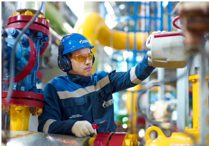
Главная ценность предприятия – люди

– Я уверен, что все, состоящие в Объединенной первичной профсоюзной организации «Газпром добыча Уренгой профсоюз» (а это 99 процентов работников Общества), пони-