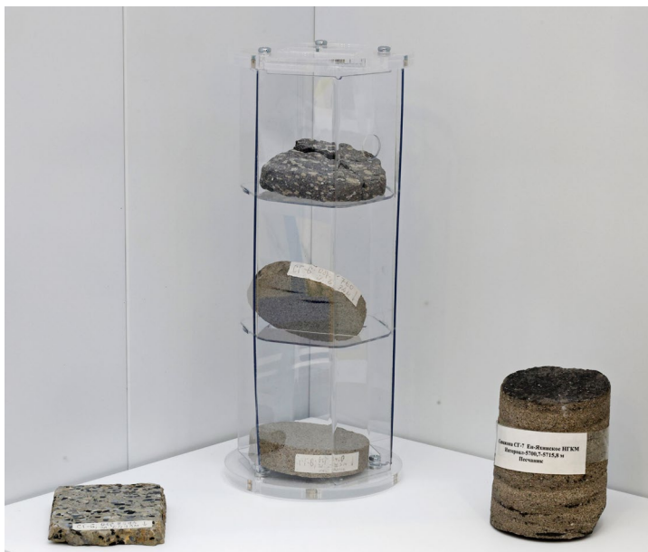
Образцы керна сверхглубокой скважины, пробуренной на Уренгойском месторождении, стали экспонатами Музея истории Общества

Однако в процессе работ было принято решение об углублении Ен-Яхинской скважины до 8 250 метров. Температура на забое составила 217 градусов по Цельсию, гидростатическое давление – 160 МПа. Специалисты использовали промывочную жидкость под названием «полимер-лигно-сульфанатный буровой раствор», которая разрабатывалась институтом ЗапСибБурНИПИ специально для этой скважины.