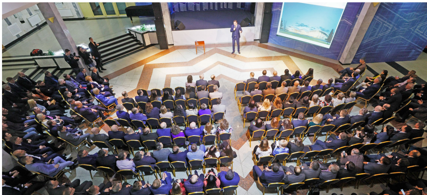
Встреча с главой Нового Уренгоя – это возможность узнать больше о городских проектах и озвучить темы, которые волнуют

Отличная новость для жителей южной части: близится к финалу благоустройство озера Молодежного. Набережная готова, она ждет завершающего этапа