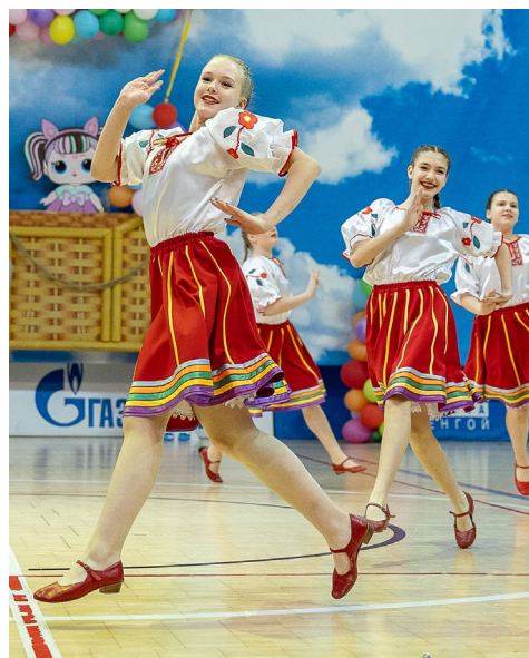
Фитнес-фестиваль – это долгожданный праздник личных достижений и побед, ярких красок и неповторимых эмоций. Здесь царит особая атмосфера, которой наполняются как участники, так и зрители

Учредитель – ООО «Газпром добыча Уренгой». Издатель – ООО «Газпром добыча Уренгой». 629307, ЯНАО, г. Новый Уренгой, ул. Железнодорожная, 8. Главный редактор Т.Р. Асабина. Газета «Газ Уренгой» зарегистрирована в Управлении Федеральной службы по надзору в сфере массовых коммуникаций, связи и охраны культурного наследия по Тюменской области и ЯНАО. Свидетельство ПИ № ФС72-0929Р от 28.04.2008 г. Адрес редакции: 629300, г. Новый Уренгой, пр. Ленинградский, 3 А, служба по связям с общественностью и СМИ ООО «Газпром добыча Уренгой». E-mail: gazeta@gd-urengoy.gazprom.ru. Газ. связь: 99-67-38, 99-67-39, 99-67-57. Газета подписана в печать фактически в 10.00. По графику – в 10.00. Заказ № 15. Тираж 500 экз. Усл. печ. листов 1,2. Гарнитура «Times New». Распространяется бесплатно (12+). Дизайн, верстка, печать: ССО и СМИ ООО «Газпром добыча Уренгой». Электронная версия газеты на сайте www.urengoy-dobycha.gazprom.ru