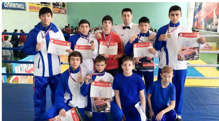
Открытие сезона для новоруренгойских кикбоксеров прошло удачно

В башкирском городе Туймазы в конце января прошли Всероссийский чемпионат и первенство по кикбоксингу среди спортивных клубов. За победу на турнире боролись почти пять сотен бойцов из различных регионов страны, в их числе кикбоксеры из Нового Уренгоя.