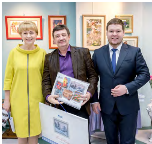
Творчество радует, окрыляет, вдохновляет и объединяет!