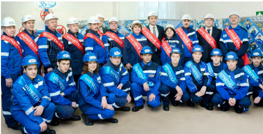
Опыт ветеранов и энергия молодых — отличный производственный тандем

Для Уренгойского газопромывислового управления 2015 год — юбилейный. Головному филиалу Общества «Газпром добыча Уренгой» исполняется 35 лет. Этому знаменательному событию в течение года будет посвящено множество мероприятий. Старт юбилейным торжествам дала Почетная вахта, которая по сложившейся традиции в особо значимые моменты истории предприятия проходит на первом газовом промысле.