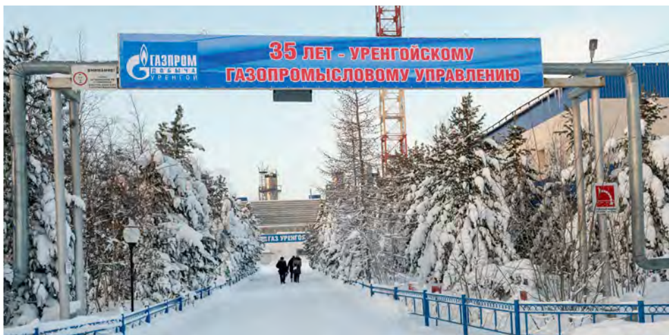
Первый газовый промысел — традиционная площадка для Почетной вахты