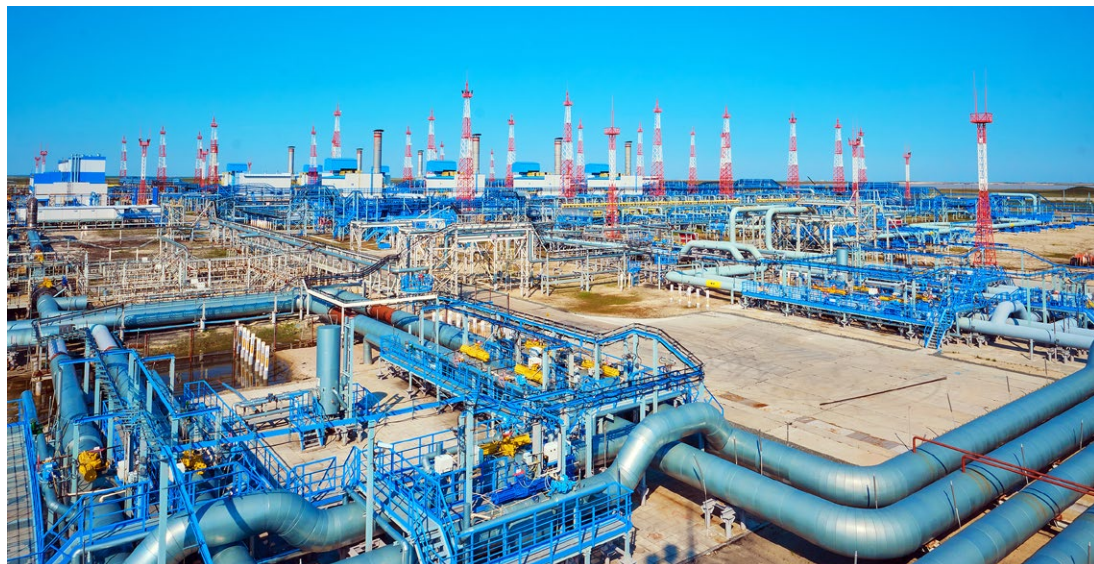
Газовый промысел № 16 Уренгойского нефтегазоконденсатного месторождения

По материалам Управления информации ПАО «Газпром» Фото с сайта ПАО «Газпром» и Владимира БОЙКО