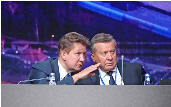
Алексей Миллер и Виктор Зубков

Потенциальная максимальная суточная производительность наших ПХГ была выведена на уровень 812,5 миллиона кубометров. За последние восемь лет компания увеличила этот показатель на 31 процент.