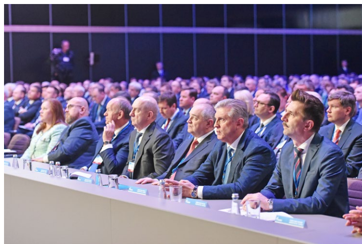
Собрание акционеров – важное событие в жизни компании

Следует подчеркнуть, что углеродный след полного цикла добычи и использования газа меньше, чем у других видов топливных