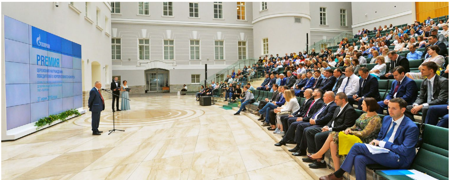
Церемония награждения победителей корпоративного конкурса прошла в Главном штабе Государственного Эрмитажа

Подготовила Ирина РЕМЕС ■