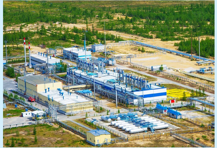
В 2018 году Общество выполнило все плановые показатели и обязательства по добыче и подготовке к транспорту углеводородного сырья

«Газпром» продолжает освоение Ямала. Вслед за Бованенковским мы начали полномасштабное освоение Харасавэйского месторождения. Его запасы газа составляют два триллиона кубометров. Проектный уровень