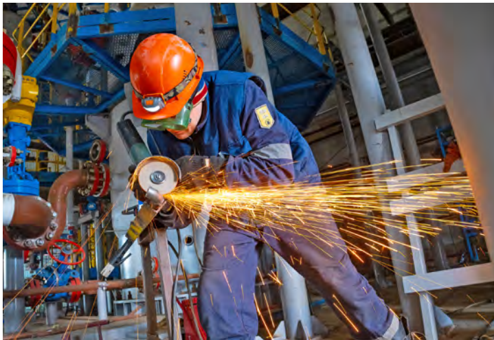
Обвязка входного сепаратора в цехе подготовки газа и конденсата

стройка идет и на значительном расстоянии от промысла, в тундре. Уже завершено строительство семнадцати из двадцати четырех скважин. Еще четыре буровые установки сейчас в действии. Как правило, скважины удалены от цеха подготовки углеводородов. Самый дальний из новых кустов находится в двенадцати километрах от промысла, самый ближний – всего в двух и виден прямо с дороги. К нему мы и направились, чтобы оказаться в самом центре событий.