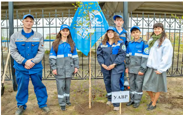
Пусть зеленых насаждений в городе будет как можно больше!