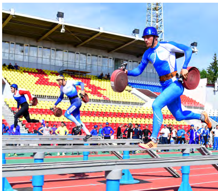
Преодоление стометровой полосы с препятствиями

– В пожарно-прикладном спорте для меня самое сложное упражнение – соединить разветвление на полосе с препятствиями. Еще одна трудность – максимально сконцентрироваться и выдать результат на соревнованиях не хуже, чем на тренировках. Обычно тренер помогает, дает напутствие и это помога-