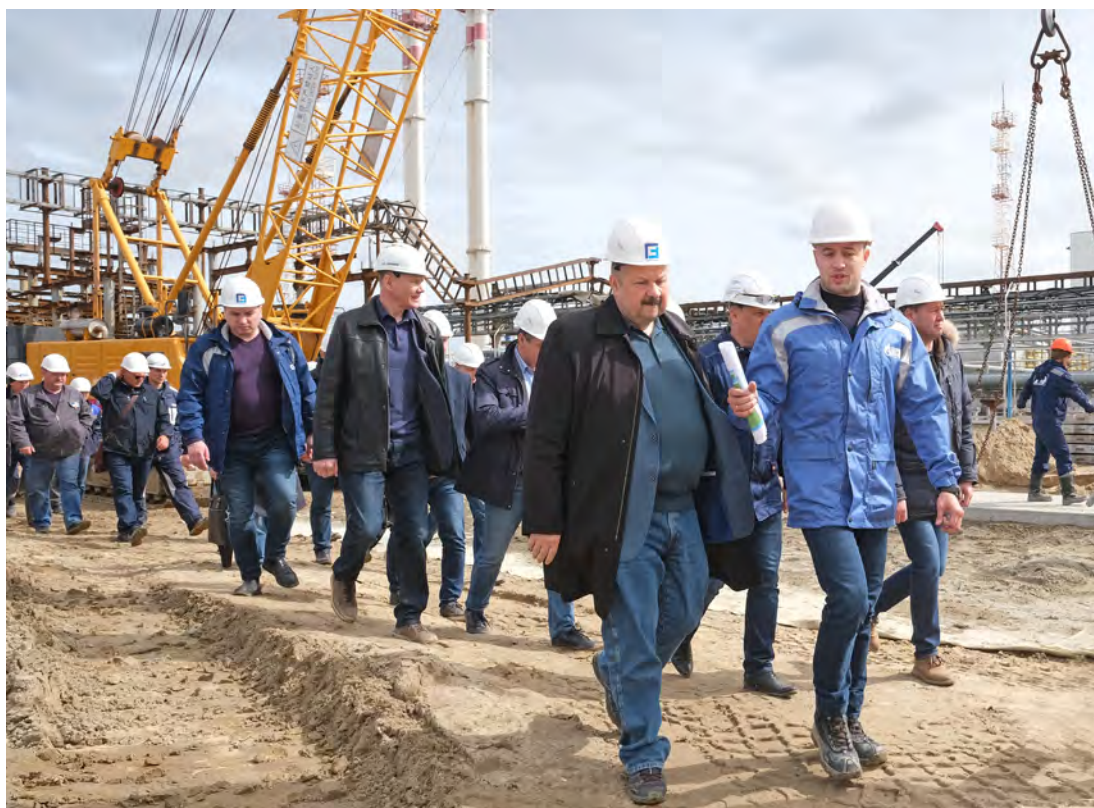
Рабочие моменты выездного совещания

ООО «Газпром добыча Уренгой» на этой неделе приняло у себя выездное совещание ПАО «Газпром». В состав делегации, посетившей Новый Уренгой с деловым визитом, вошли руководители и специалисты департаментов газового концерна, его дочерних компаний, а также представители подрядных организаций, работающих на объектах Общества.