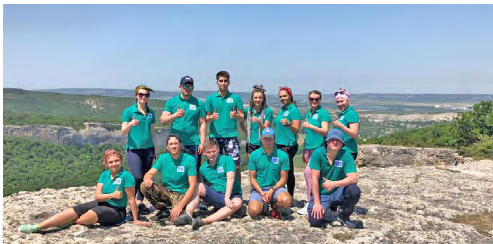
Вместе работаем, вместе отдыхаем

– «Через горы к морю» – это уникальный и, можно сказать, патриотический проект, наполненный историей и географией родной страны. Объединенная первичная профсоюзная организация готова поддерживать новые, креативные, а самое