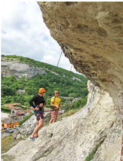
Лучше гор могут быть только горы...