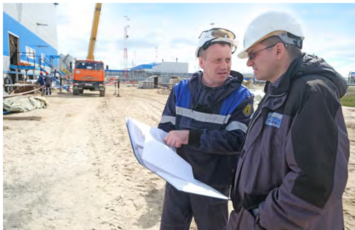
Обсуждение хода строительства – непосредственно на объекте

месторождения. В первую очередь комиссию интересуют перспективные проекты Общества «Газпром добыча Уренгой» –