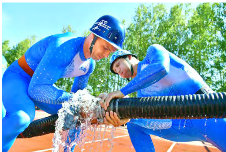
Соединение рукавной линии во время боевого развертывания