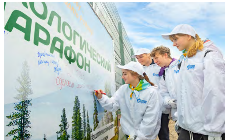
На экологический марафон – с добрыми помыслами