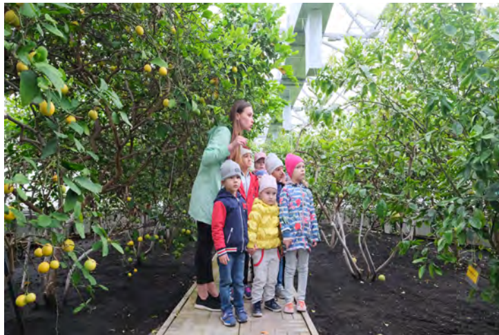
В атмосфере субтропиков

Вырастить лимоны на Крайнем Севере? Почему бы и нет! В том, что это возможно, убедились воспитанники детского сада «Белоснежка». Познавательная экскурсия для малышей в лимонарий прошла в рамках тематической недели здоровья.