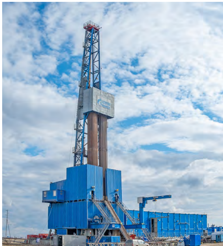
Реализация проекта начинается с бурения

В настоящее время территорию установки комплексной подготовки газа № 22 Общества «Газпром добыча Уренгой», пользуясь военной терминологией, можно назвать передовой. Здесь развернулось масштабное строительство. Ради скорейшей реализации перспективного проекта предприятия бурятся скважины, возводятся новые технологические сооружения и расширяется существующая система газопроводов. Подрядчики рапортуют, что уже половина намеченного пути пройдена. Еще немного, и промысел будет готов выйти на проектные мощности.