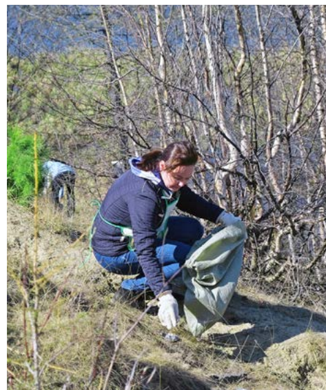
Вклад каждого – важен