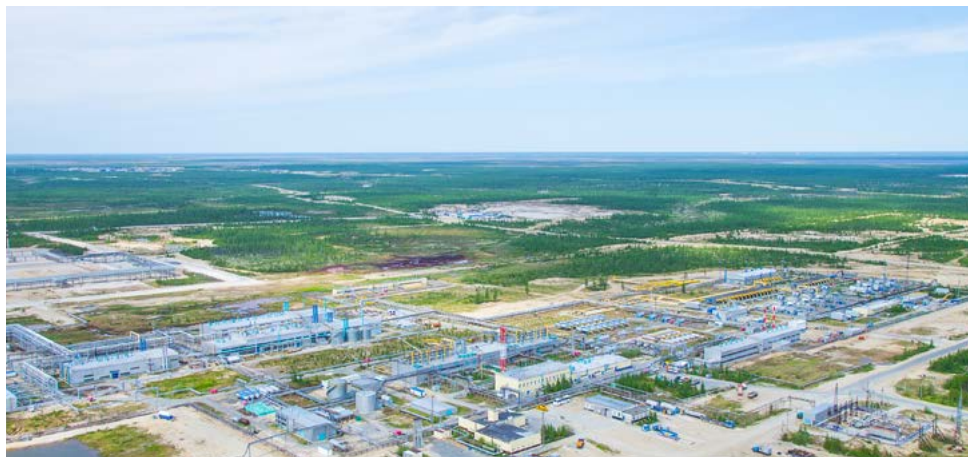
Уренгойское нефтегазоконденсатное месторождение

Со схемой расположения магистральных газопроводов можно ознакомиться на сайте ООО «Газпром добыча Уренгой» в разделе «пресс-центр», далее – «объявления» по ссылке: urenгой-dobycha.gazprom.ru/press/obyavleniya/ .