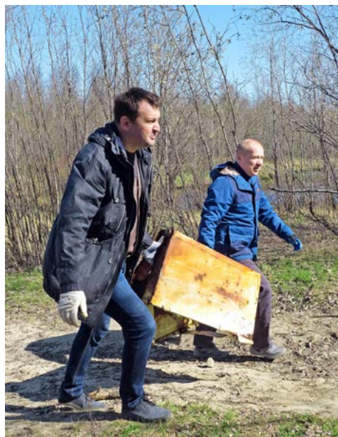
Сделать город чистым и красивым – в наших силах!