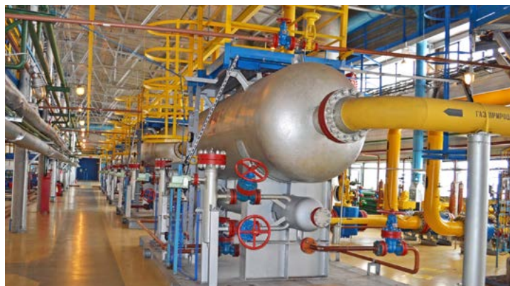
Газоконденсатный промысел № 5 готовится к бесперебойной работе в зимнее время

— У нас большие планы на время остановки промысла. По заключению экспертизы промышленной безопасности мы будем проводить замену тройника Ду1000 на входном трубопроводе в цех очистки газа сеноманской дожимной компрессорной станции. В планах — ремонт трубопровода импульсного газа, системы подачи метанола на кусты в здании