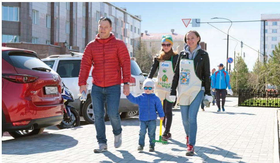
На субботник всей семьей