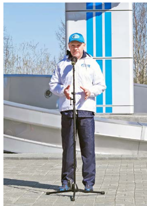
Напутствие перед субботником – от генерального директора