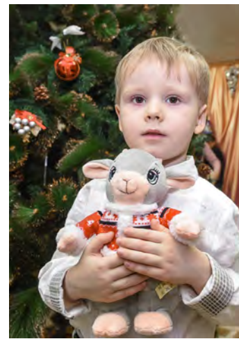
Малыш с символом 2015 года