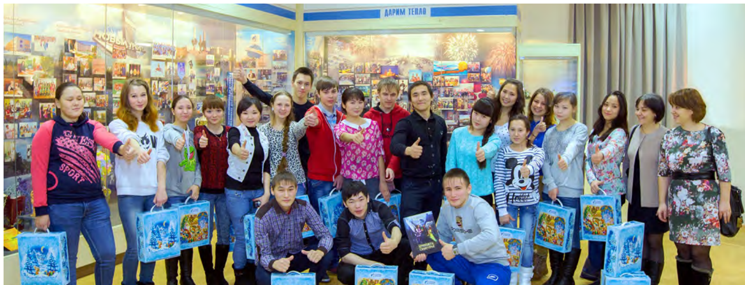
Новогоднее настроение и подарки от газозиков ребята увезли из Нового Уренгоя домой — в Самбург