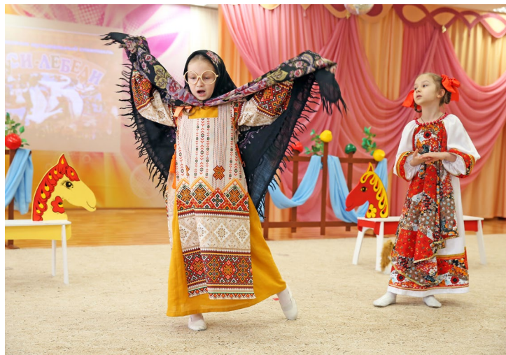
На сцене – артисты детского сада «Княженика» с инсценировкой русской народной сказки «Гуси-лебеди»