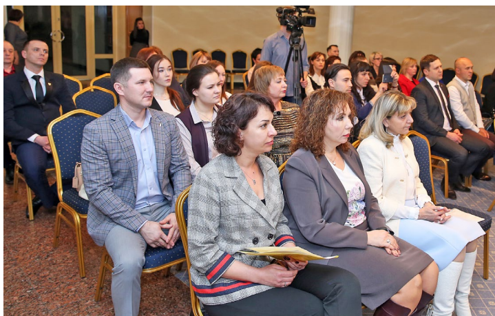
Организаторы и участники конкурса на церемонии награждения

«Взгляд в будущее». Она предполагает внедрение инновационных методик и технологий работы с подрастающим поколением, нацелена на духовно-нравственное и патриотическое воспитание молодежи, а также выявление и поддержку одаренных детей. Обладателями грантов стали: Молодежный центр «Норд» с проектом «Ямал-профи», нацеленным на привлечение подрастающего поколения к техническим дисциплинам; региональная молодежная общественная организация «Дивизион» с программой «Судьба солдата», которая предусматривает организацию поисковой экспедиции «Вахта памяти-2019»; коротчаевский Центр культуры и досуга «Магистраль» и их «Медиашкола «КадрЫ», призванная обучать молодежь информационной грамотности; средняя школа № 16 с профориентационным проек-