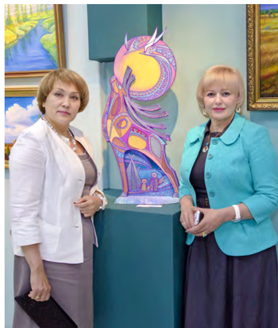
На выставке творческих работ газодобытчиков