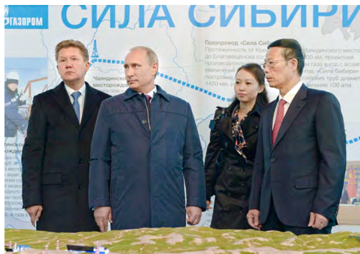
Алексей Миллер, Владимир Путин и Чжан Гаоли

Амурской области, Еврейской автономной области и Хабаровского края. Общая протяженность составит порядка 4000 км, проектная производительность — 38 миллиардов кубометров газа в год. К концу 2018 года будет построен участок от Чаяндинского месторождения в Якутии до Благовещенска (на российско-китайской границе) протяженностью более 2200 км. В дальнейшем запланировано строительство участка от Ковыктинского месторождения в Иркутской области до Чаяндинского (около 800 км), а в перспективе — от города Свободного в Амурской области до Хабаровска (около 1000 км). Таким образом, «Сила Сибири»