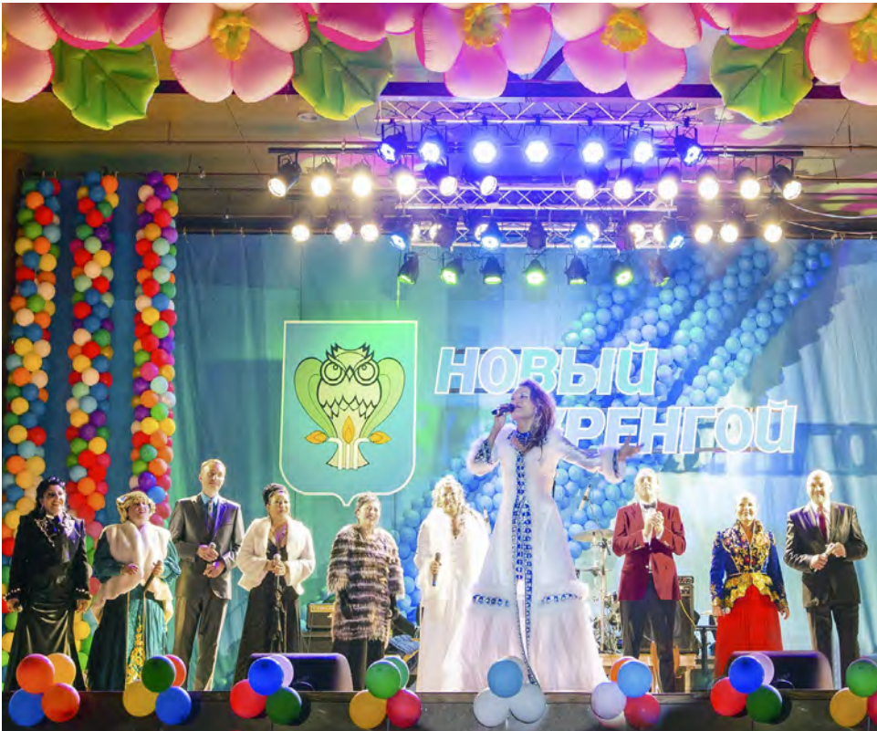
Все наши песни — тебе, Новый Уренгой!