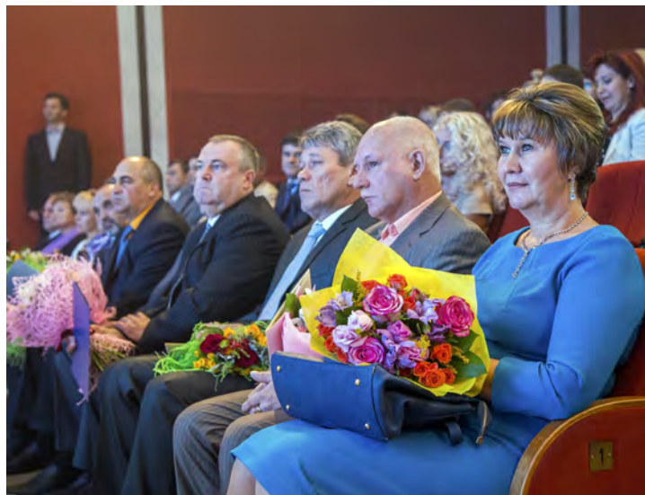
В большом концертном зале КСЦ «Газодобытчик» царила праздничная атмосфера