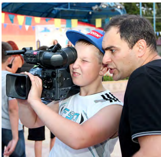
Учиться — всегда пригодится