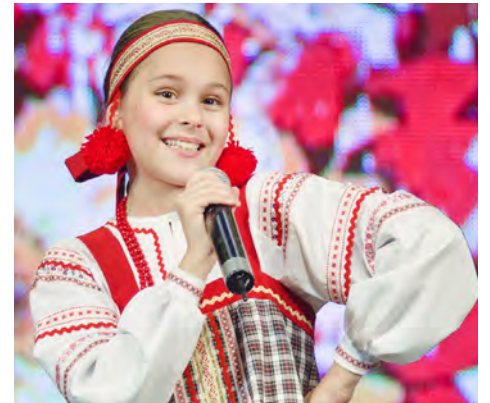
Юные северяне — народ творческий