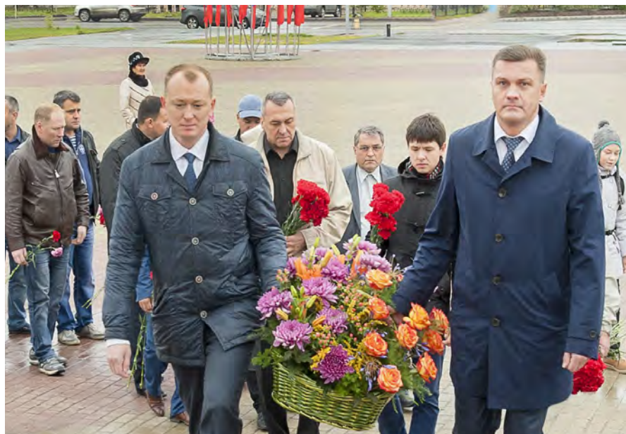
Возложение цветов к Вечному огню и другим памятным местам — традиция, особенно чтимая в нашем городе