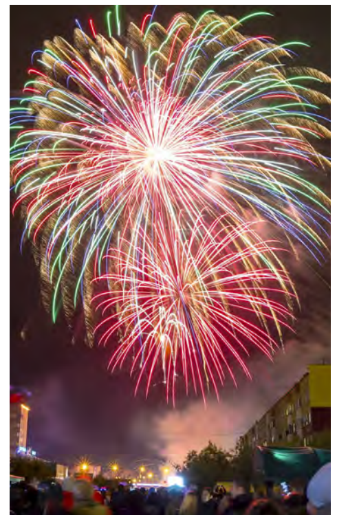
И рассыпался звездами салют...