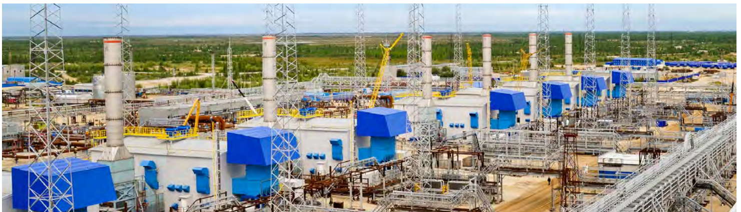
На строительной площадке ДКС-1АВ.