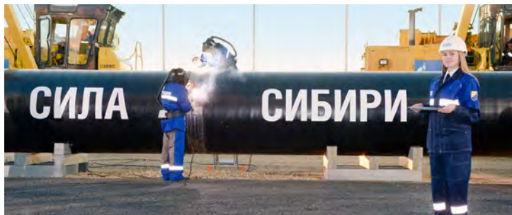
Сварка первого стыка газотранспортной системы

В Якутске состоялись торжественные мероприятия, посвященные сварке первого стыка газотранспортной системы (ГТС) «Сила Сибири». Она станет важнейшим элементом создаваемой на Востоке России системы газоснабжения. По ГТС газ Якутского и Иркутского центров газодобычи будет поставляться дальневосточным потребителям и в Китай.