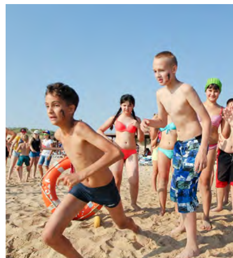
Бегом в море!