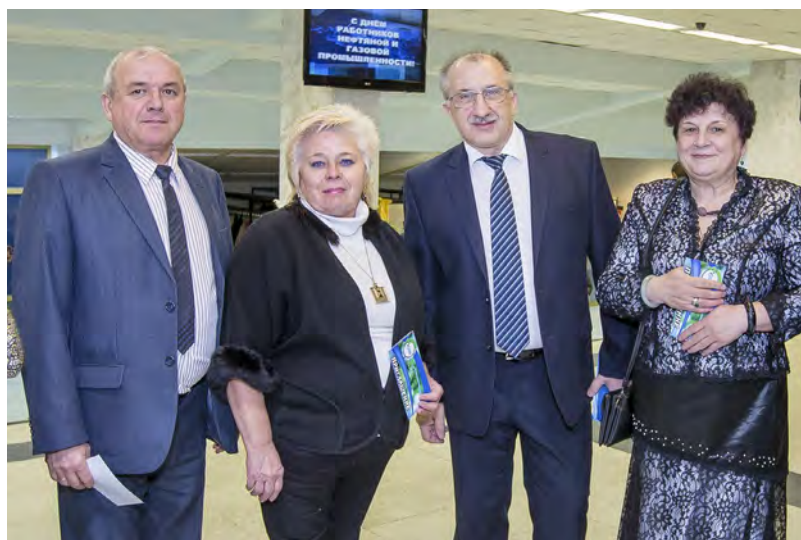
Культурно-спортивный центр «Газодобытчик», как всегда, тепло и гостеприимно встречал виновников торжества