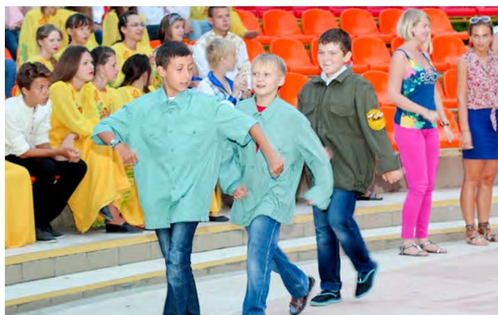
За мной шагом марш!