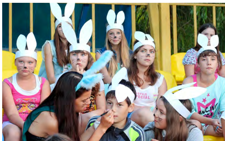
Отряд очаровательных зайчат

Смена закончилась прощальным костром, концертом и футболками с надписью «Я люблю «Кубанскую ниву», в которых дети вернулись из лагеря, и из которых они теперь не вылезают. В ночь перед отъездом их, естественно, как следует перемазали зубной пастой. От чего они стали еще счастливее.