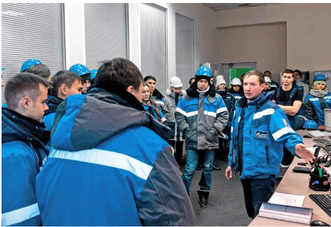
Экскурсия на УКПГ-II для молодых работников из разных филиалов предприятия