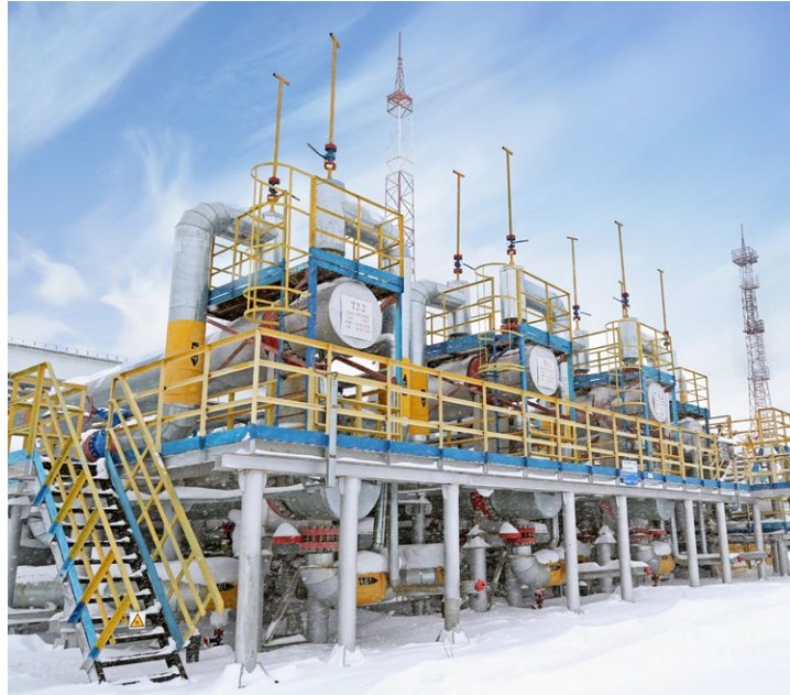
Газоконденсатный промысел № 22 – самый молодой и перспективный добычный объект Общества

ПАО «Газпром» планирует построить в районе Усть-Луги завод по переработке «жирного» газа мощностью около 45 миллиардов кубометров в год.