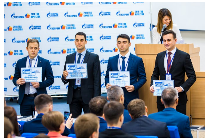
Научно-практическая конференция, посвященная Году качества в ПАО «Газпром»

Это и многое другое произошло благодаря вам! Спасибо за активность, желание помогать другим, стремление к развитию, сплоченную и дружную командную работу, спасибо за весь 2018 год! ■