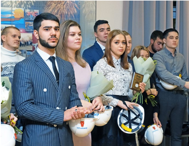
На церемонии посвящения в газодобытчики. Нас больше с каждым днем!

Переступив порог 2018-го и уверенно шагнув в 2019-й, мы решили оглянуться назад и подвести итоги прошедшего, продуктивного для нас года.