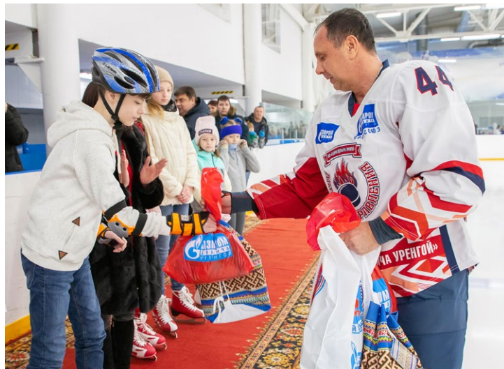
Подарки – детям