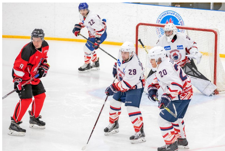
Матч между «аппаратчиками» и «газодобытчиками»

Игра получилась зрелищной и богатой на голевые моменты. Фортуна благоволила команде Уренгойского газопромышленного управления, которая и победила в этой ледовой битве со счетом 10:2.