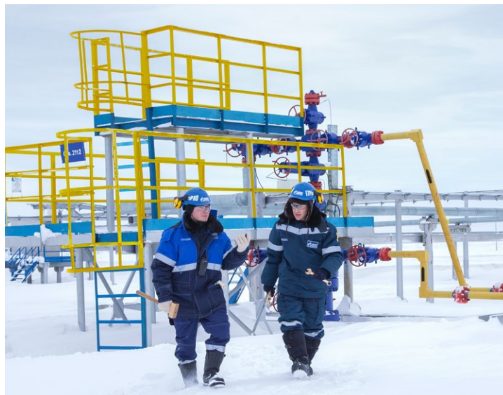
Число скважин на ГКП-22 постоянно увеличивается. Добываемый здесь ачимовский газ в ближайшем будущем будет использоваться не только как сырье для топлива, его планируют поставлять и на объекты переработки