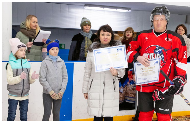
Денежные сертификаты от первичных профсоюзных организаций филиалов будут переданы в фонд «Ямине»

В рамках сотрудничества Общества «Газпром добыча Уренгой» с благотворительным фондом «Ямине» финансовую помощь на реабилитационное лечение детей получили следующие работники: