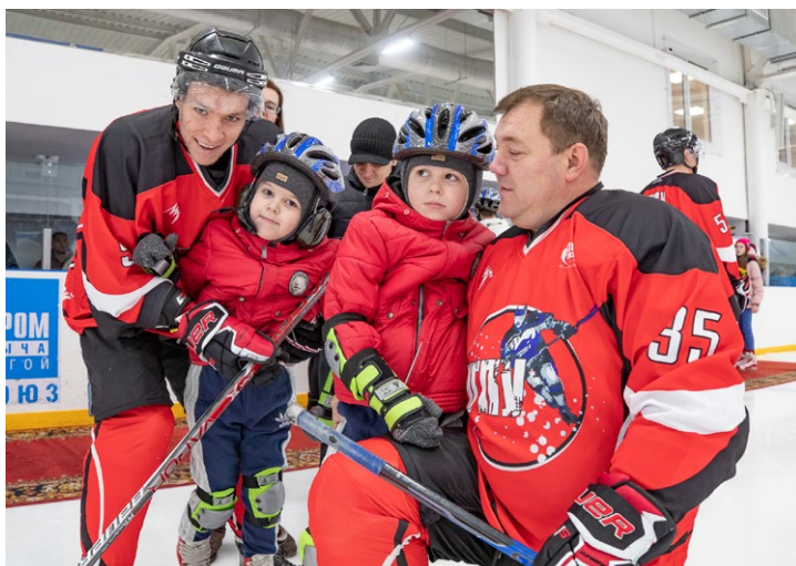
Участвующие в проекте дети смогли выйти на лед вместе с хоккеистами

ходящим, до слез были тронуты неподдельным восторгом своих детей.