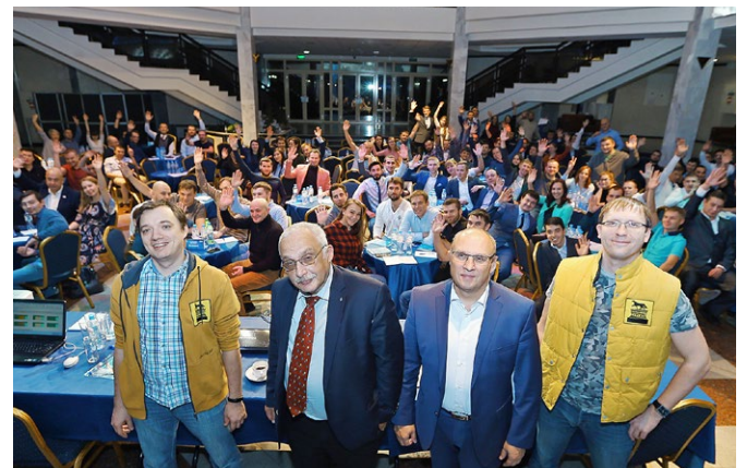
«Игры разума» – V Открытый чемпионат по интеллектуальным играм. Специальный гость – Александр Друзь