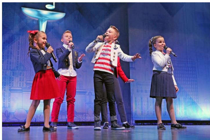
Младшая группа «Алфавита» с песней «Корабли»