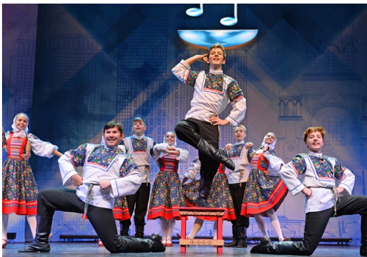
В средней возрастной категории «Сюрприз» исполнил танец «Задоринка»

– Мне довелось поработать председателем жюри – мы оценивали выступления наших коллективов и принимали решение о том, какие номера будут представлять Общество на зональном туре конкурса. Но только когда побываешь на самом «Факеле», становится ясно, насколько высок уровень мастерства его участников. Я приехал поддержать наши коллективы, ведь артисты не могут без эмоций. Выступая, они знают, что мы переживаем за них, и это придает им уверенность и силы.