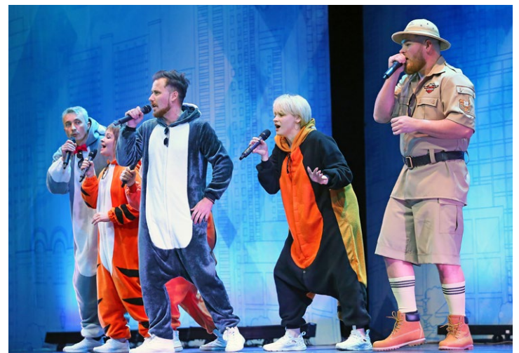
Вокальная группа «Полюс» покорила зрителей