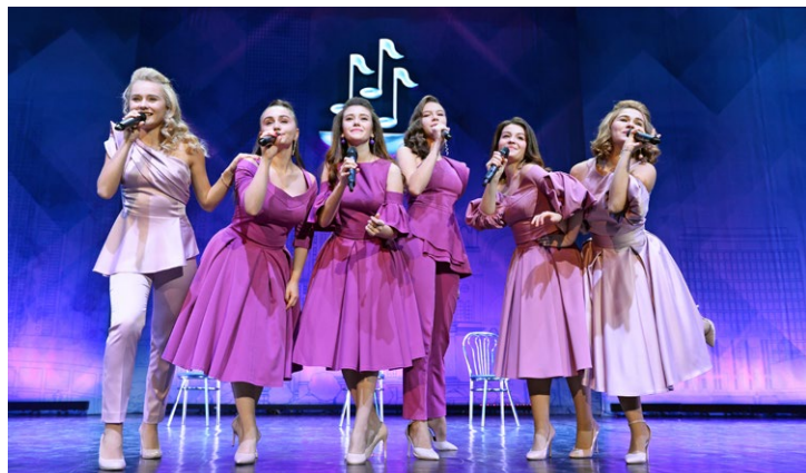
«Прованс» в исполнении Образцового вокального коллектива «Алфавит»