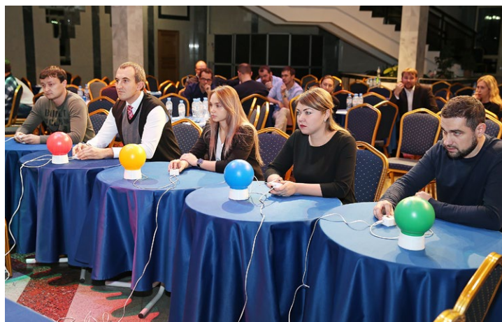
«Эрудит-квартет» – командная «Своя игра»