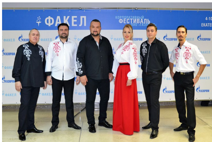
Коллектив инструментального ансамбля «НУарт-ПРОЕКТ»