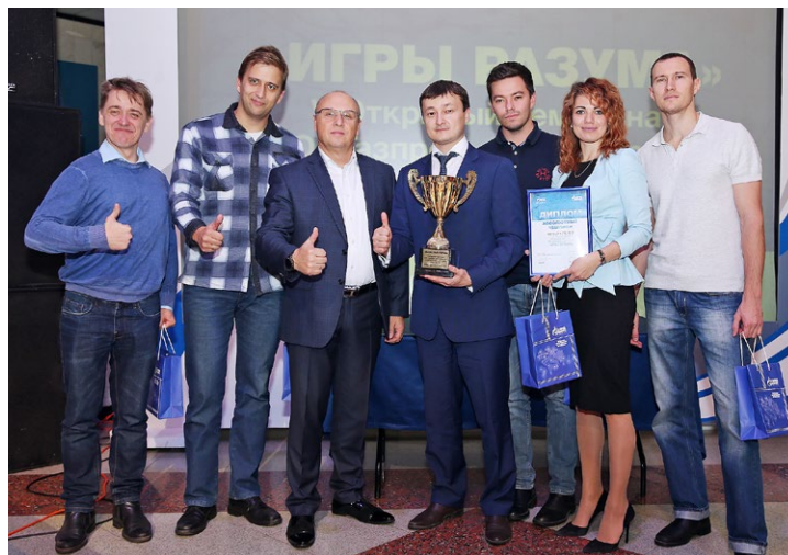
Сборная Аппарата управления Общества – абсолютные чемпионы «Игр разума» – 2018

В общем зачете итоговая тройка распределилась следующим образом: объединенная команда проектировщиков из обществ «Газпром добыча Уренгой» и «Газпром переработка» «Не вопрос!» взяла главный трофей, следом за ними – знатоки АО «Арктикгаз» и сборная ООО «Газпром добыча Надым» «Джоуль» – первая в истории «Игр разума» команда не из Нового Уренгоя. В корпоративном зачете «Своей