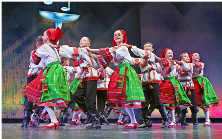
«Орловские воротца». На сцене – младшая группа ансамбля танца «Сюрприз»