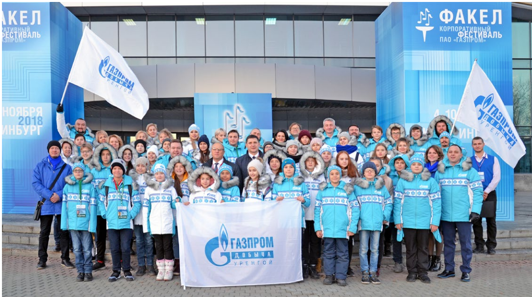
Делегация Общества «Газпром добыча Уренгой» на фестивале – одна из самых многочисленных

день тяжелый. Особенно, если на него приходится начало конкурса. И так, 5 ноября на сцену ККТ «Космос» наши творческие коллективы и исполнители выходили пять раз. Конкуренция среди артистов – достойная, ведь все без исключения основательно готовились к выступлениям. Зал поддерживает не только «своих» – об этой объединяющей силе искусства будут говорить на протяжении всех дней «Факела». Четырехчасовой марафон первого дня и после его окончания отдавался звонким эхом увиденного и услышанного, настолько оригинальными были представленные номера, а уровень мастерства артистов всех возрастов превосходил любые ожидания!