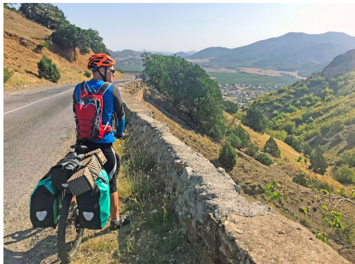
До цели еще сотни километров...

Рельеф местности не позволял найти ровного места, поэтому в тот раз ночевать пришлось прямо возле дороги – рядом с трансформаторной будкой. Выехали, как всегда, рано утром и до жары