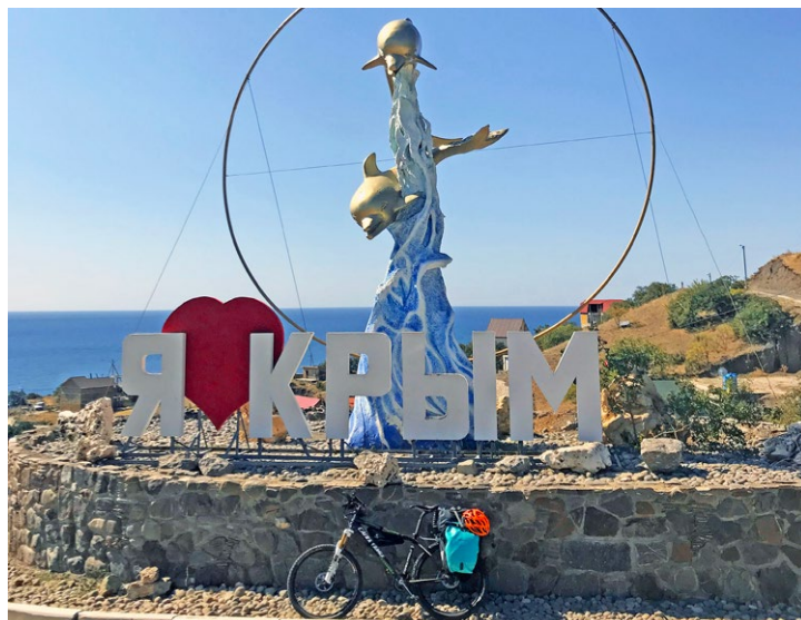
Я люблю Крым... а также лето и активный отдых!

Забегая вперед, скажу, что чистота Крымского побережья оставляет желать лучшего. Отдыхающих слишком много, пляжи переполнены. Места, которые раньше считались относительно труднодоступными, сейчас легко покоряются кроссоверам. А культуры курортникам явно не