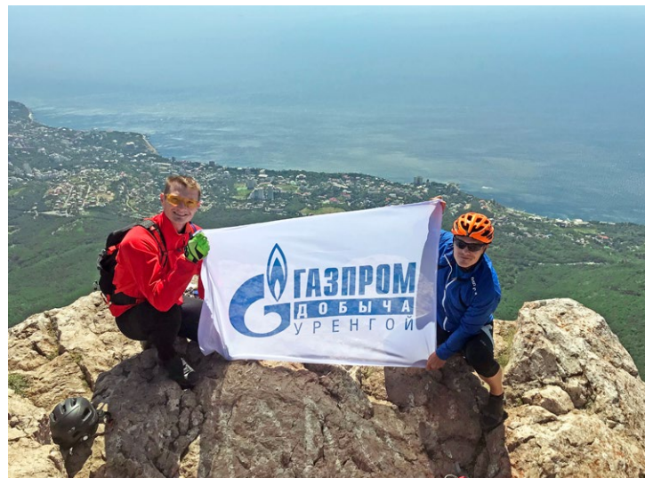
В путешествие – с флагом родного предприятия