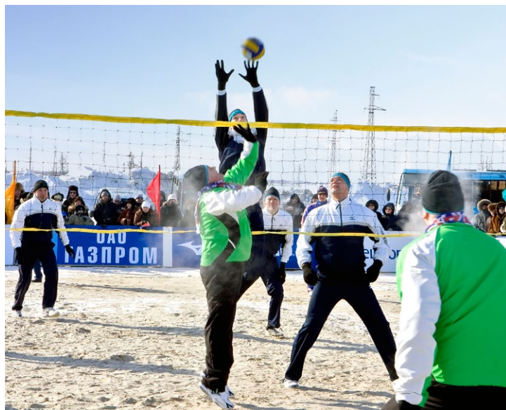
Волейбольный матч на 66-ой параллели

В июне 2006-го газета повествует о сорокалетии со дня открытия Уренгойского нефтегазоконденсатного месторождения. Публикация называется «От первой скважины – к большому газу!»: «На площади у памятника «Пионерам освоения Уренгоя», на месте бывшей «развахтовки», откуда в свое время начинали путь на строящиеся и уже действующие газовые промыслы «Урал-вахты», собрались после рабочего дня горожане всех возрастов