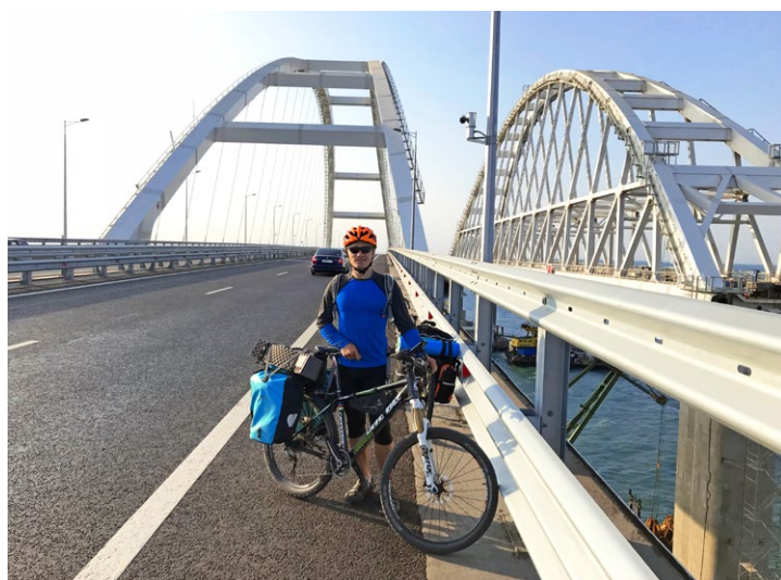
По Крымскому мосту на велосипеде

основному потоку. Сошли с трассы перед самым мостом, когда уже ощущалась близость моря. Стройка подъездных путей шла в круглосуточном режиме, и хоть палатки мы поставили как можно дальше от дороги, всю ночь, мешая спать, неподалеку ездили самосвалы и работал бульдозер.