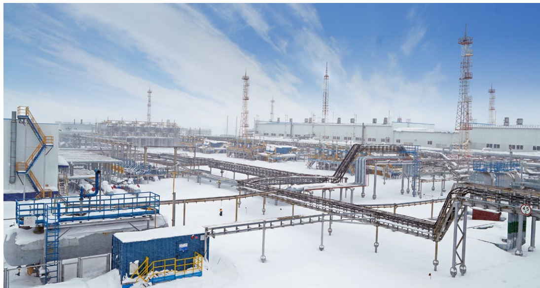
Газоконденсатный промысел № 22

Ачимовские горизонты – настоящее и ближайшее будущее ООО «Газпром добыча Уренгой». Будущее уникальное, требующее от газодобытчиков применения новых идей и методик, особого подхода, никогда ранее не применявшихся. Вместе с производственниками в сложном, но крайне интересном процессе освоения и разработки этих недр трудятся инженеры ИТЦ, люди науки и творчества. Сегодняшняя наша публикация – об отделе технологического мониторинга объектов обустройства ачимовских отложений, и о тех проектах, в которых принимают участие специалисты Инженерно-технического центра и Газопромывлового управления по разработке ачимовских отложений.