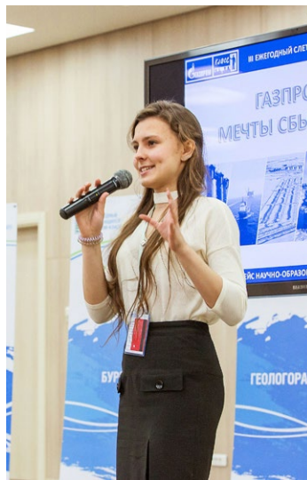
Деловое общение – это тоже наука

которого были поделены на 14 команд. Уникальные роли всем школьникам были определены, исходя из их интересов, способностей и предрасположенности к тому или иному виду деятельности. Так, в каждой команде появились генеральный директор, директоры по стратегии, экономике, технологии, производству, PR и IT. Важный нюанс – группы были составлены таким образом, что в них входили представители «Газпром-классов» из разных регионов страны.