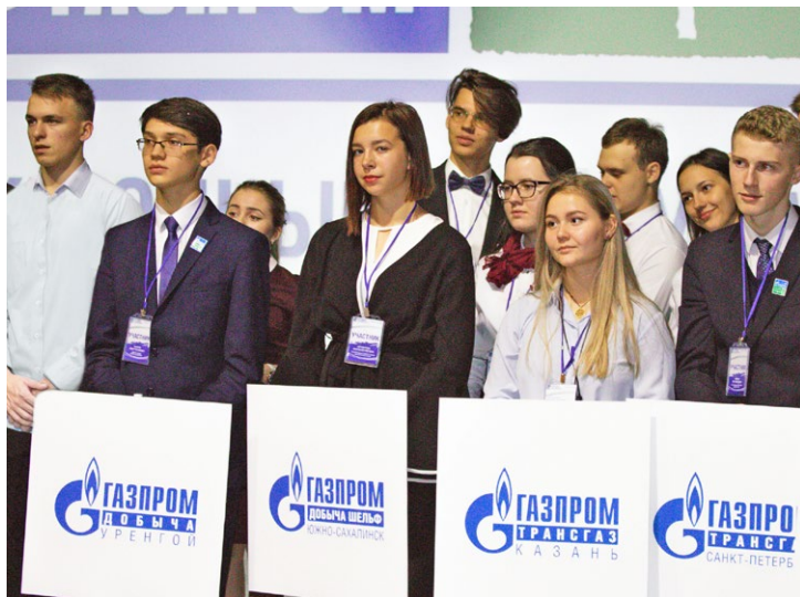
Уфа встречает гостей

Ученики «Газпром-классов» Общества «Газпром добыча Уренгой» приняли участие в III ежегодном слете участников корпоративного проекта ПАО «Газпром» в Уфе. Мероприятие объединило 122 школьников «Газпром-классов» из 23 регионов России. Обширная программа включала в себя несколько блоков: научно-образовательный, культурно-досуговый, спортивный, экскурсионный и командообразующий.