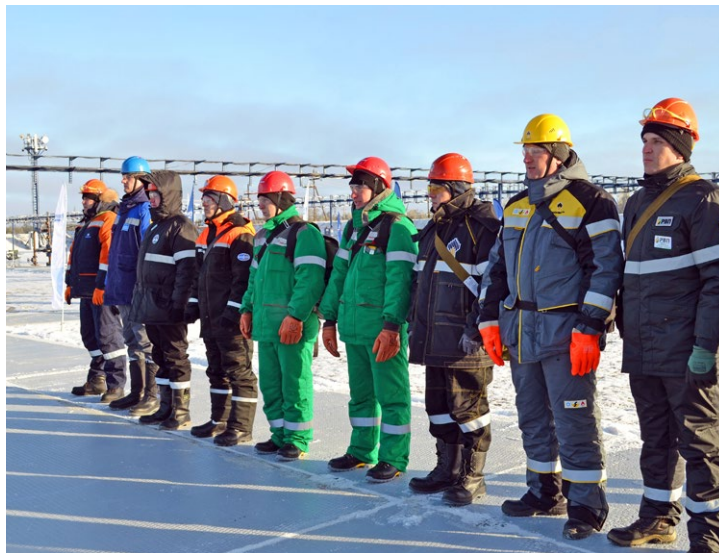
Выступить за свое предприятие на конкурсе «Лучший по профессии» – почетно и престижно

Торжественное открытие конкурса было организовано на площадке перед центральным офисом предприятия – это фактически центр Ноябрьска. Так что очевидцами мероприятия стали многие горожане. Музыка, флаги, национальная атрибутика, теплые слова и добрые напутствия участникам события – все говорило о том, что конкурс – это еще и праздник. Гостей приветствовали глава города и руководители принимающей компании. Они обозначили важность и масштабность события, пожелали успехов участникам.