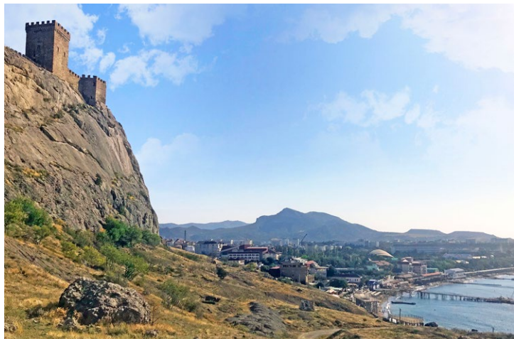
Вид на бухту Судака и Генуэзскую крепость

успели добраться до Алушты. Нашли свободное место на пляже, пристегнули велосипеды и купались весь день. Алушта – типичный представитель курортных городов: санатории, сдача жилья «100 метров до моря», магазины с купальными принадлежностями и кафе на любой вкус. Вечером сделали must-have-фото с алуштинской ротондой и поехали дальше.