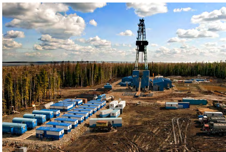
Чаинское месторождение (на снимке слева) станет базовым для создания и развития Якутского центра газодобычи, который, наряду с Иркутским центром, войдет в газотранспортную систему «Сила Сибири», предполагающую транспортировку газа на Дальний Восток России и в Китай

Управление информации ОАО «Газпром» Фото с сайта ОАО «Газпром»