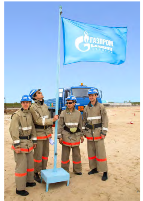
К соревнованиям готовы

Служба по связям с общественностью и СМИ