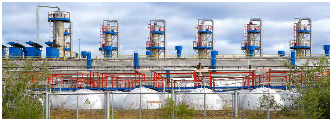
С самого начала освоения Уренгойское месторождение зарекомендовало себя как площадка для апробирования и внедрения передовых технологий нефтегазодобывающей отрасли