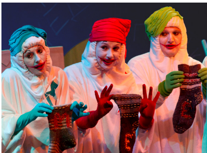
«Северная сцена» — единственный профессиональный театр на Ямале. Фрагмент спектакля «Зоки и Бада»