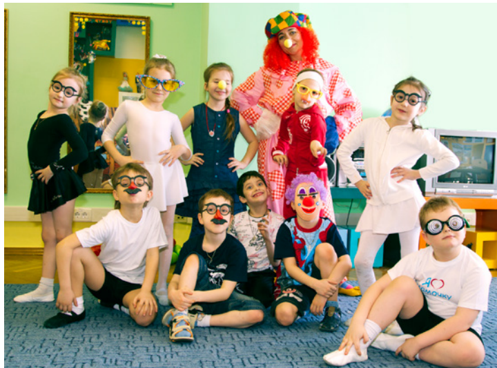
Педагоги Центра эстетического развития на протяжении многих лет занимаются воспитанием дошколят