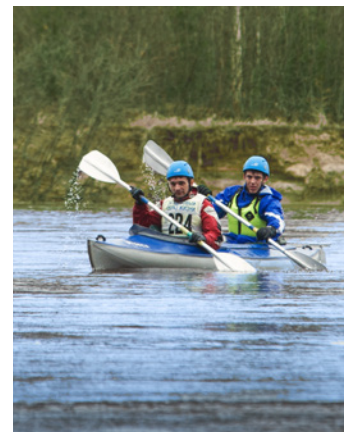
Вперед, к финишу!

Каждый год на «Яха-марафоне» обязательно находится и те, кто впервые решается проверить свою выносливость и силу воли. Маркшейдеру службы главного маркшейдера аппарата управления Общества «Газпром добыча