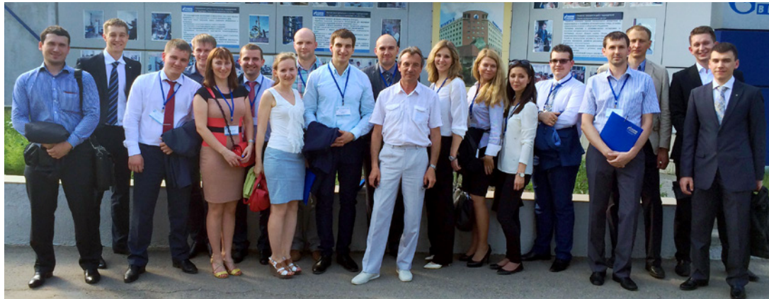
Участники семинара.

Открытие семинара, приуроченного к 66-летию со дня основания ООО «Газпром ВНИИГАЗ», состоялось в здании пресс-центра научно-исследовательского института. Программа трехдневного съезда ученых включала в себя освещение важнейших вопро-