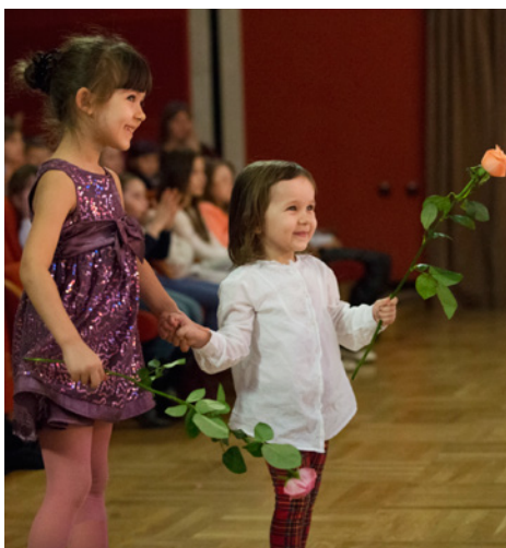
Цветы актрисе — от чистого детского сердца

Анна Ардова еще в детстве решила продолжить династию. Правда, в ГИТИС ее зачислили только с пятой попытки. Азы профессии Анна постигала у режиссера Андрея Гончарова, а потом поступила на службу в театр имени Маяковского, где работает и ныне. В кино Ардова начала сниматься с 1983 года. На протяжении пяти сезонов она играла в скетчком «Женская лига» на одном из телеканалов, благодаря которому и получила известность. В 2009 году ей была предложена главная роль в шоу «Одна за всех» уже на другом канале. Проект стал одним из главных хитов, а Ардова получила премию «ТЭФИ» за лучшую женскую роль в телесериале в 2010 году.