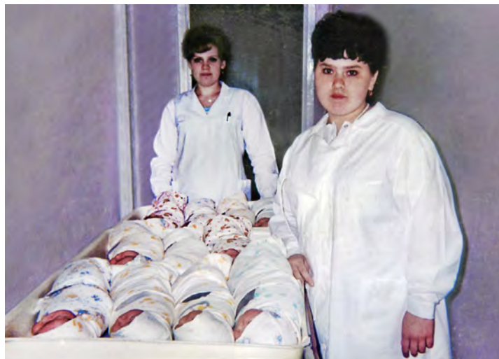
На кормление к мамам. 1999 год

Подготовила Ирина АНИСИМОВА