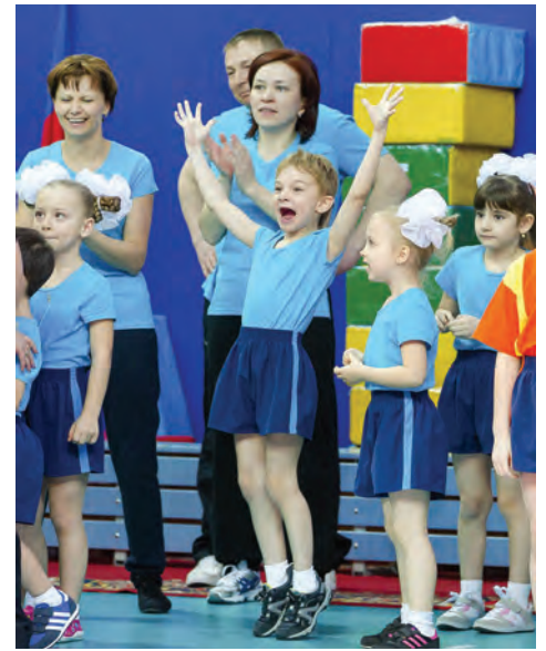
Радость через край

У нас — общая история и общее будущее. Веками взаимопонимание и взаимопомощь людей разных культур были основой исторического развития цивилизации. И мы с вами