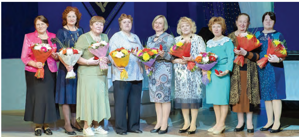
Активисты клуба «Третий возраст»

Вот уже 20 лет более сотни бывших работников Общества «Газпром добыча Уренгой», а ныне пенсионеров, объединены знаменами клуба «Третий возраст». Они считают его отдушиной и стараются не пропускать ежемесячные тематические встречи, на которых вспоминают былое, живут настоящим и... радуются будущему. Очередное заседание клуба состоялось 22 апреля как всегда в КСЦ «Газодобытчик», однако прошло оно в более торжественной обстановке, чем обычно. Клуб «Третий возраст» отметил юбилей.