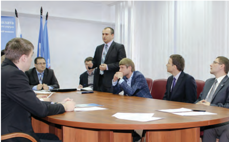
Участники круглого стола