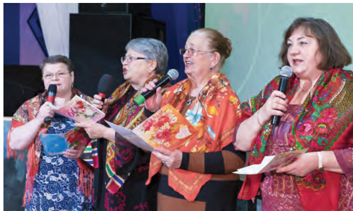
Какой же праздник без душевной песни в исполнении «золотых голосов» клуба «Третий возраст»