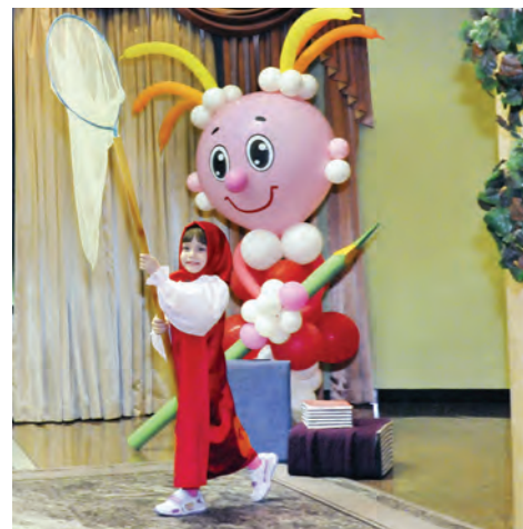
По мотивам любимой истории