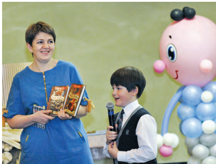
Мы с книжкой лучшие друзья!