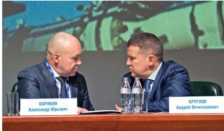
Обсуждение актуальных вопросов

– Сквозная интеграция бизнес-процессов и автоматизирующих их IT-решений, а также использование цифрового кодирования, начиная с уровня информационно-управляющих систем головной компании и до контрольно-измерительных приборов на производственных объектах, позволит достичь оперативности