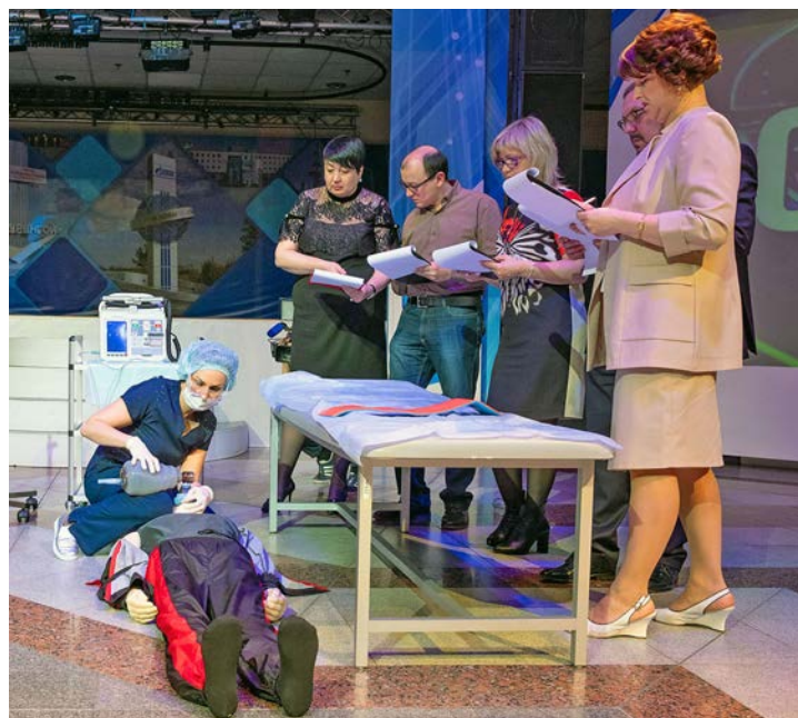
Базовая сердечно-легочная реанимация – один из этапов конкурса профмастерства. Жюри оценивает технику и тактику проведения манипуляций фельдшером

Ирина РЕМЕС