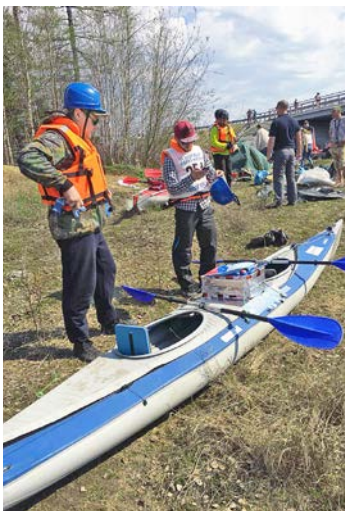
Тщательная подготовка на старте – залог успешного финиша

Ирина РЕМЕС