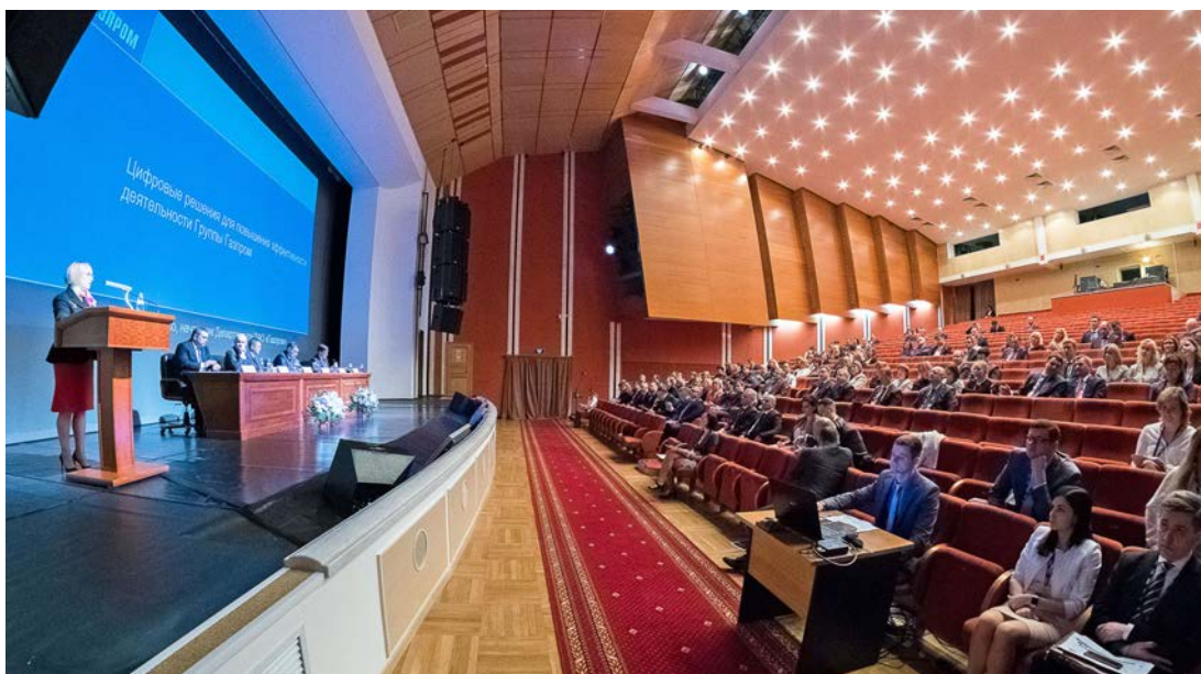
На пленарном заседании

В Новом Уренгое состоялось отраслевое совещание руководителей финансово-экономических служб администрации и дочерних Обществ ПАО «Газпром». Организатором мероприятия выступило Общество «Газпром добыча Уренгой». В рамках пленарного совещания были озвучены новые направления в работе финансово-экономических служб газового концерна, обсуждены актуальные аспекты взаимодействия администрации ПАО «Газпром» и дочерних обществ по вопросам финансово-экономического планирования, внедрения цифровых технологий для повышения эффективности деятельности компаний Группы «Газпром». Обсуждались и другие актуальные для всех дочерних обществ темы.