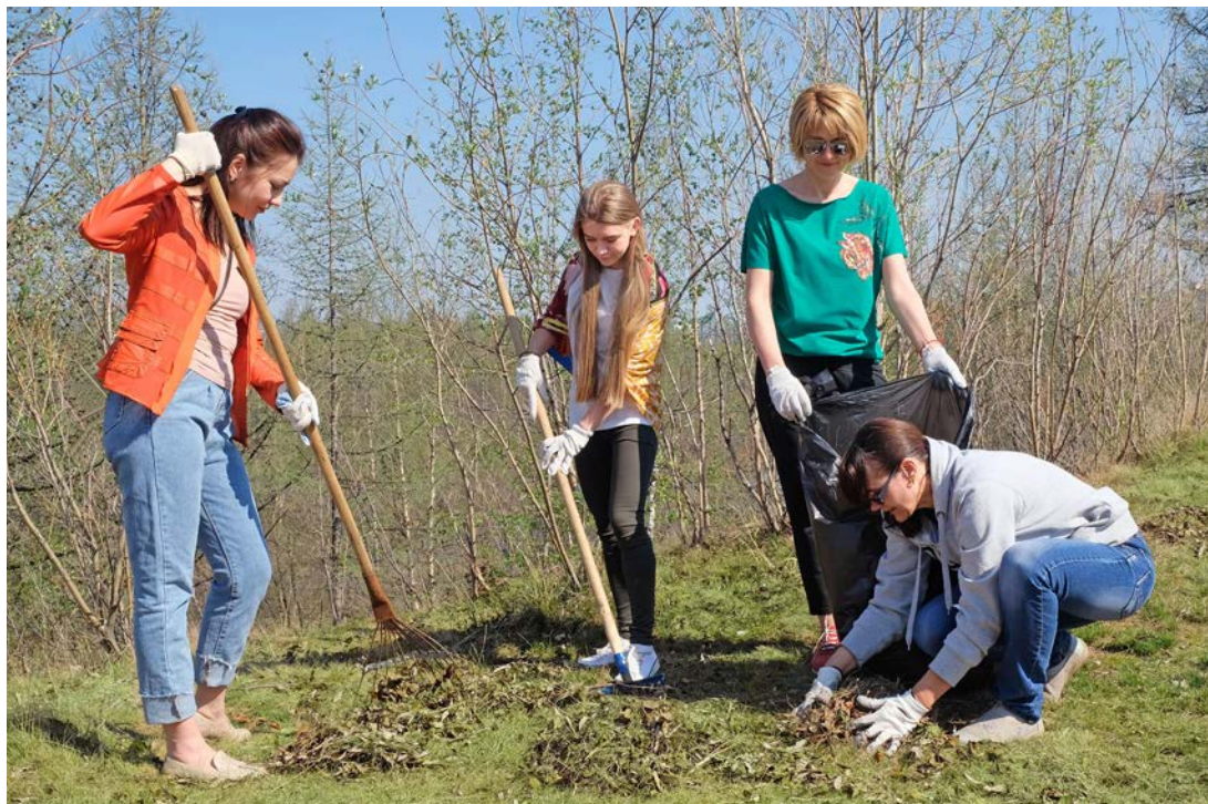
Работники ООО «Газпром добыча Уренгой» присоединились к Всероссийскому экологическому субботнику «Зеленая весна – 2018». Более шестисот сотрудников администрации и служб Общества вышли на уборку прилегающей территории зданий и объектов предприятия (на снимке).