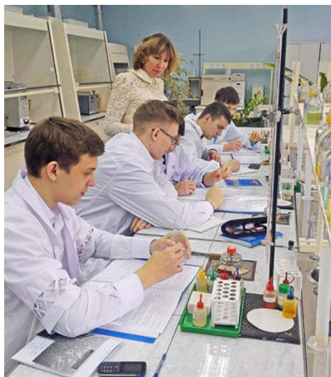
Практическое занятие по химии

В сентябре 2013 года в Новом Уренгое впервые стартовали «Газпром-классы» – уникальный совместный проект ООО «Газпром добыча Уренгой», ООО «Газпром добыча Ямбург» и Департамента образования города. Его участники – учащиеся девяти классов школ газовой столицы. Чтобы повысить качество образования, были организованы дополнительные занятия на базе ЧПОУ «Газпром техникум Новый Уренгой», старейшего учебного заведения среднего профессионального образования на Крайнем Севере.