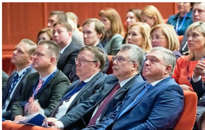
В зале – представители предприятий Группы «Газпром»

Что же касается непосредственных итогов отраслевого совещания, то, рассмотрев через призму финансово-экономической деятельности актуальные для всех дочерних обществ вопросы, были определены стратегически важные решения в системе корпоративного менеджмента. Они позволят обеспечить выполнение глобальных задач корпорации, расширят границы конструктивного сотрудничества между дочерними обществами самой крупной компании страны, существенно повлияют на оптимизацию деятельности корпоративных казначеев и откроют новые возможности для реализации интересных совместных проектов. Ведь грамотное планирование финансовых потоков, эффективная прозрачность финансово-хозяйственной отчетности – залог высоких производственных достижений и устойчивого роста капитализации, что весьма важно для поддержания репутации такой перспективной и динамично развивающейся компании, как Группа «Газпром».