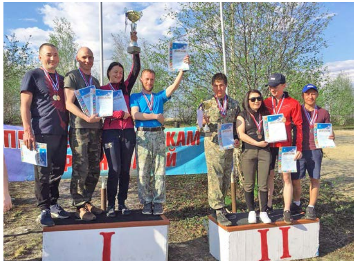
Оказаться на пьедестале почета – мечта каждого спортсмена

Впрочем, скорость тоже имела значение. Ведь по итогам марафона каждый год определяются победители. Так участники ме-