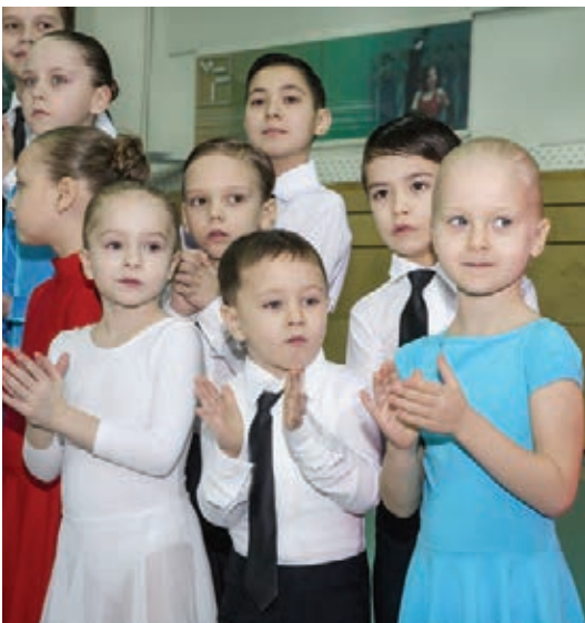
Танцы — это маленькая жизнь...