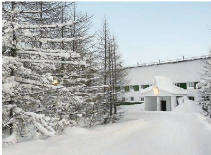
Снег пушистый, лес и солнце... И в мороз, и в летний жар Лечит тело, греет душу наш дневной стационар

Ирина АНИСИМОВА