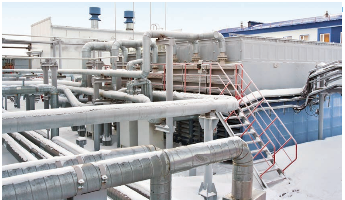
НП-2 нефтегазодобывающего управления