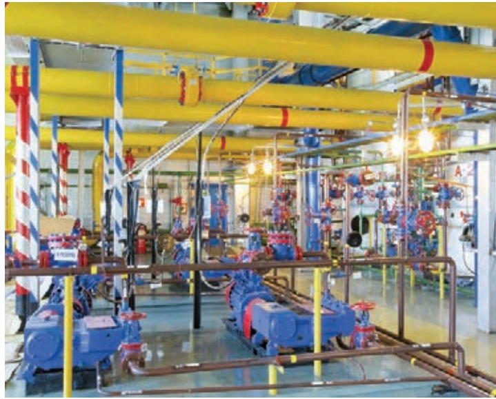
Производственный цех газового промысла № 8

На нефтепромыслах № 1 и № 2 проводились работы по вводу ряда объектов, среди которых следует отметить внедрение установок