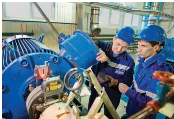
На ГКП-22 газопромыслового управления по разработке ачимовских отложений

ООО «Газпром добыча Уренгой» занимает лидирующие по-