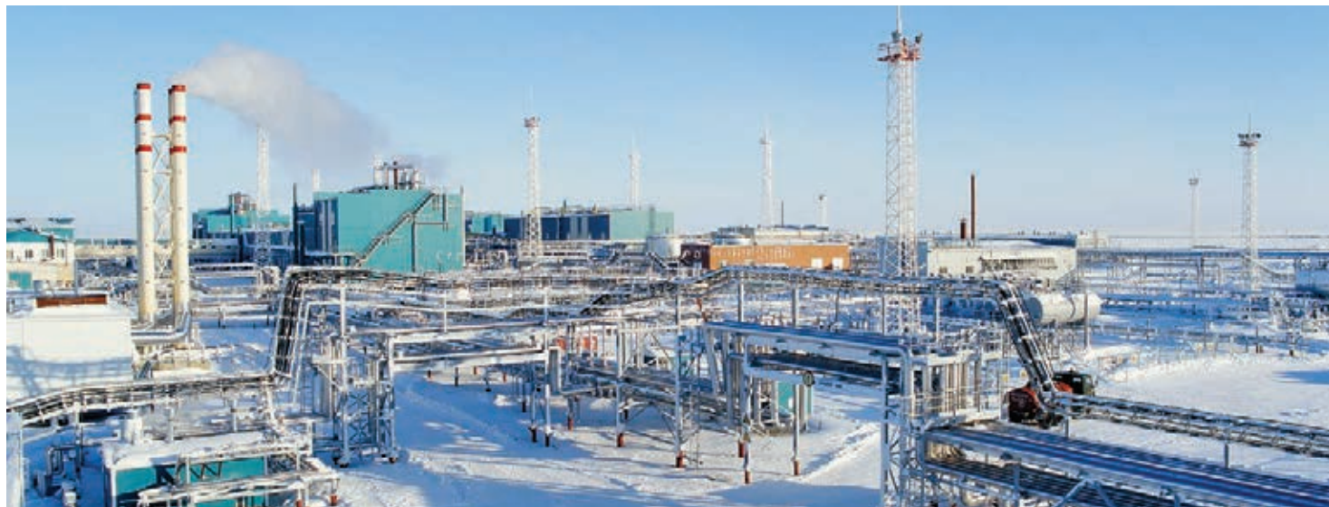
Газовый промысел № 16 Уренгойского газопромыслового управления

Для реализации проектных решений по поддержанию необходимых уровней добычи углеводородов на протяжении трех лет в «Газпром добыча Уренгой» ведется планомерная работа по строительству бокового ствола в скважинах с использованием