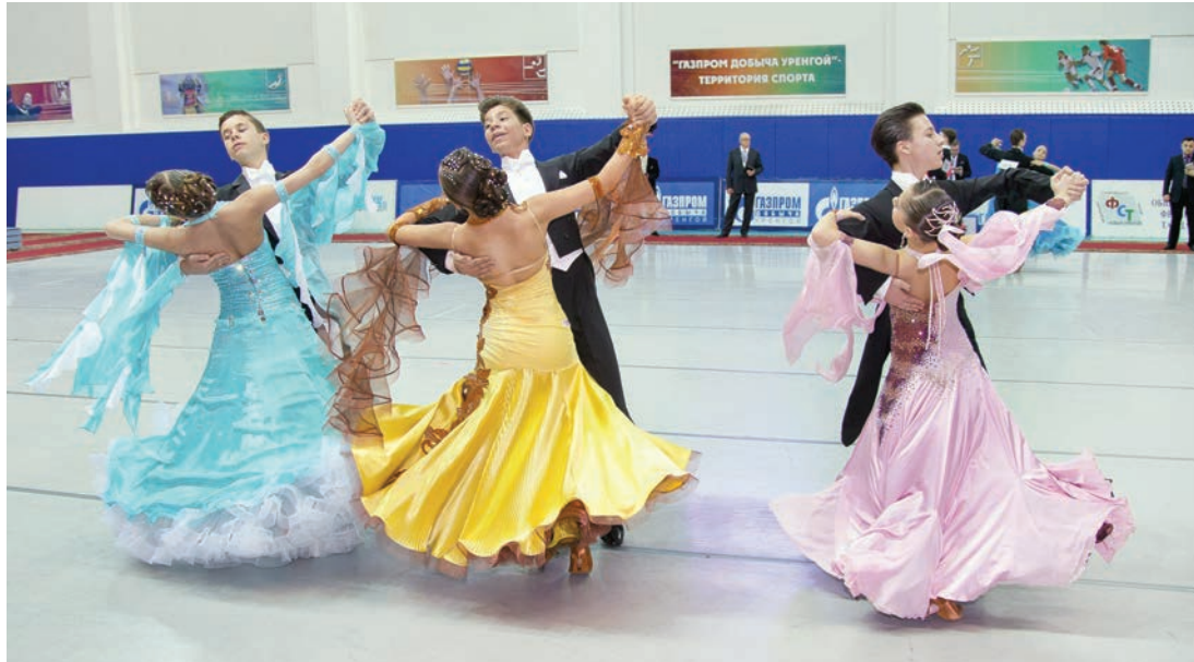
В ритме венского вальса. Первенство Уральского федерального округа в категории «Юниоры-2»