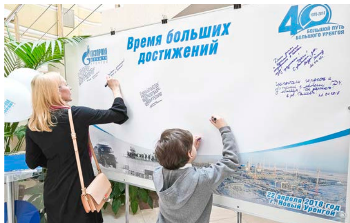
Добрые пожелания на память