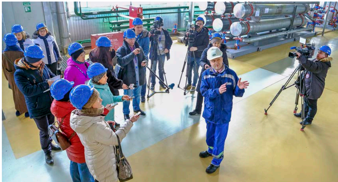
Экскурсия по производственным цехам первого газового промысла