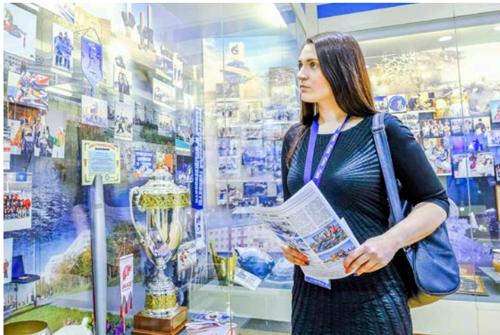
В Музее истории Общества...

Коллектив у нас молодой – достойная смена ветеранам. Немало и семейных династий, мы этому только рады, ведь когда профессионализм пере-