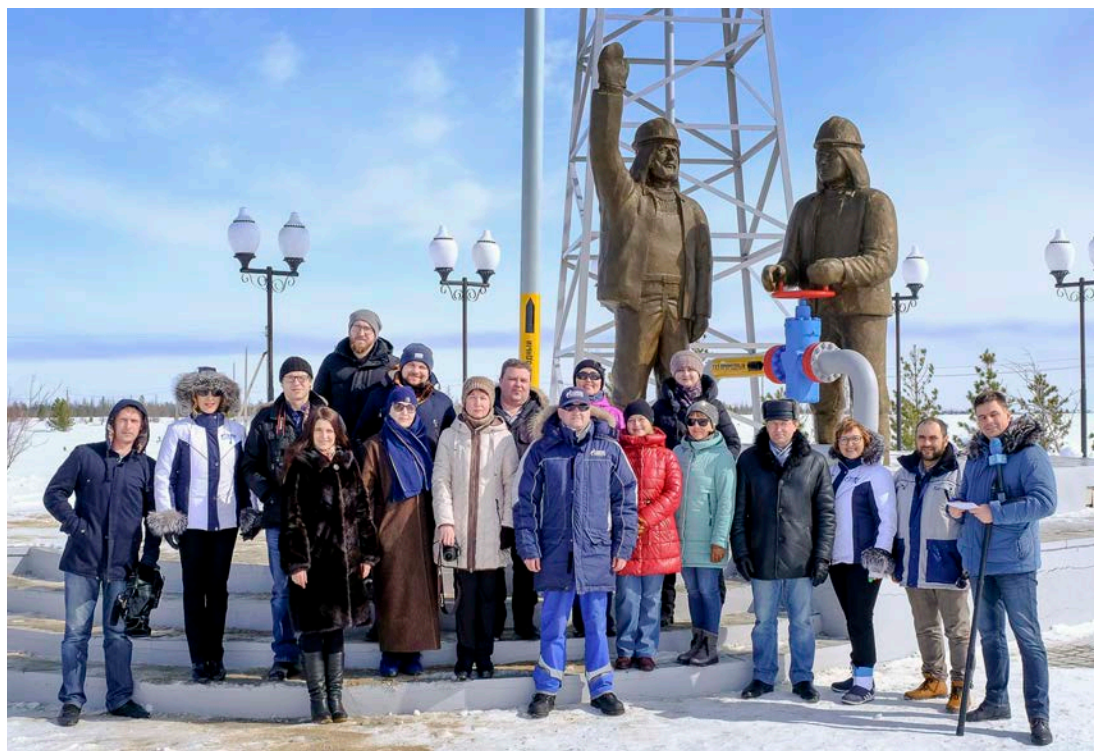
Возле памятного мемориала первопроходцам Уренгоя