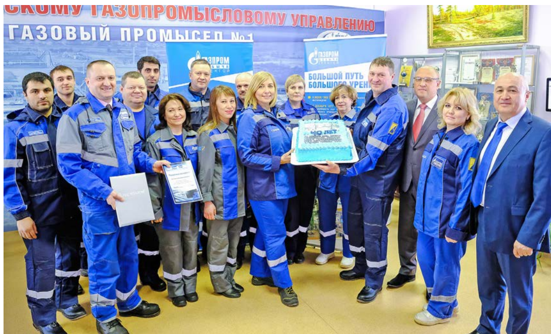
Поздравления коллективу первого газового промысла от руководства филиала и Общества

Представители федеральных, окружных и городских средств массовой информации Западной Сибири на этой неделе имели возможность окунуться в атмосферу апрельского дня, такого же, как сорок лет назад, когда в магистральный трубопровод с первого промысла был пущен первый газ Большого Уренгоя. В рамках пресс-тура «Время больших достижений», организованного специалистами службы по связям с общественностью и СМИ, они побывали на промысле-первенце и ГП-16 – одном из самых современных в Уренгойском газопромысловом управлении ООО «Газпром добыча Уренгой».