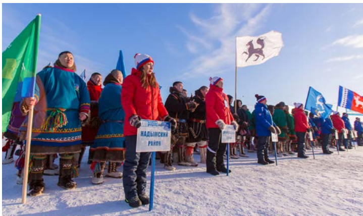
Представители десяти команд, участвующих в соревнованиях по традиционным видам спорта: гонки на оленьих упряжках, прыжки через нарты, перетягивание палки и метание тынзына на хорей