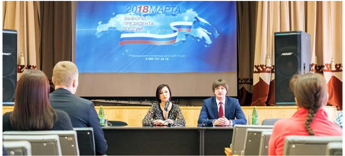
Главное для избирателя – быть информированным!

На прошлой неделе, 2 марта, работники Общества «Газпром добыча Уренгой» вновь стали участниками проекта «Электоральная активность». В этот раз площадкой для общения на тему о предстоящих выборах президента РФ стало Управление технологического транспорта и специальной техники.