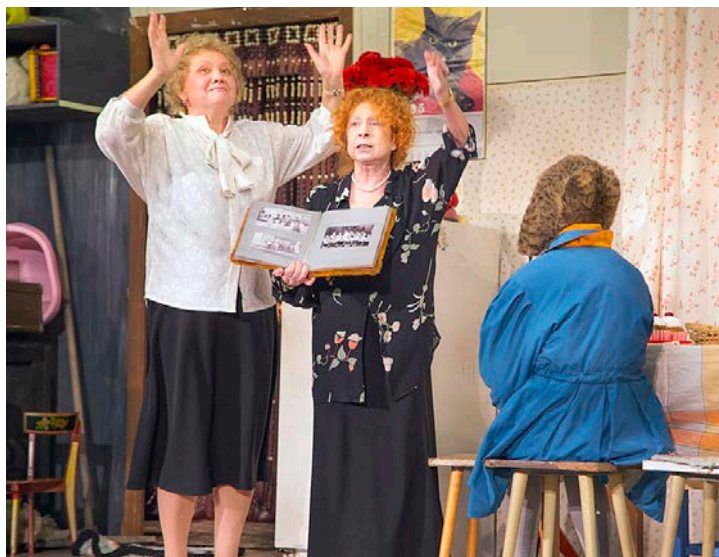
Талантливая, яркая, харизматичная...

Сюжет закручен вокруг желания Эсфирь женить сына. Она и пассию ему подходящую нашла – Сонечку, съездив в свой родной Бобруйск. Властная, решительная Эсфирь выстроила план и приступила к его реализации. Но по закону жанра отпрыск не желает строить любовь с девуш-