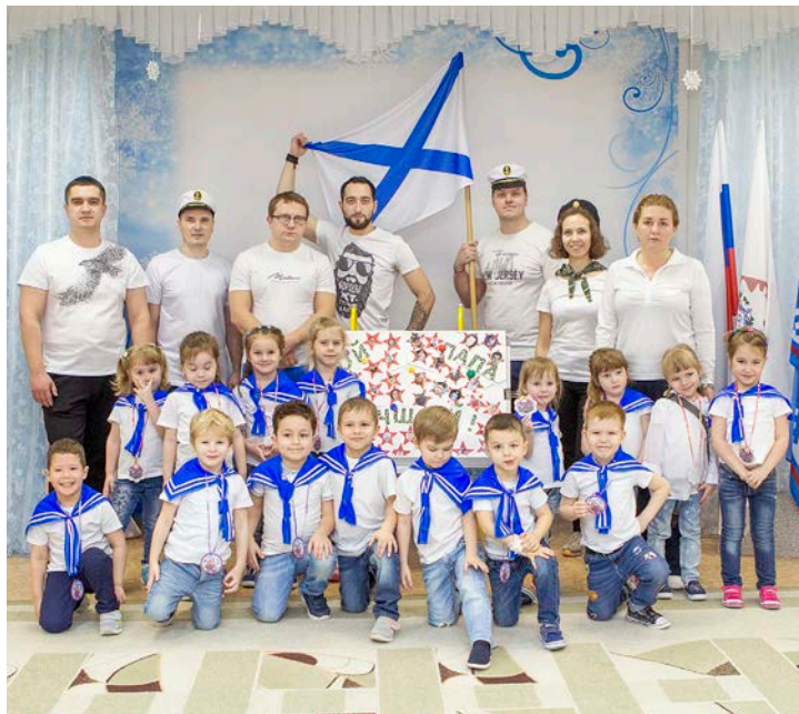
К «Зарнице» готовы!