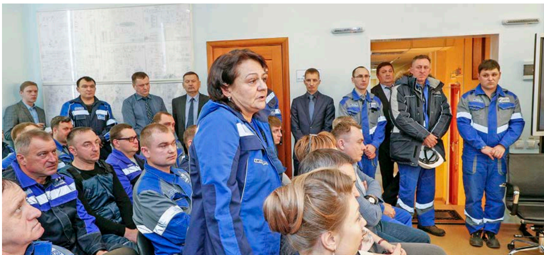
Разговор с коллективом в формате «вопрос-ответ»

Во вторник, 13 февраля, встречи генерального директора и представителей руководства Общества с трудовыми коллективами промыслов проходили на объектах компании, расположенных более чем за сотню километров от города, – в вахтовом жилом комплексе «Сеноман» и общеститеи ГП-9. В первом на встрече присутствовали работники 11, 12, 13 и 15 промыслов, на втором