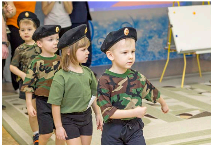
Кто шагает дружно в ряд?

Под развевающимися знаменами, чеканя шаг под звуки военных песен, маршируют мальчишки и девчонки в бескозырках, пилотках и камуфляжной форме. Все они – участники состоявшейся накануне Дня защитника Отечества военно-спортивной «Зарницы», прошедшей в детском саду «Росинка» Управления дошкольных подразделений Общества «Газпром добыча Уренгой». Игра объединила воспитателей, родителей и дошколят средних групп.