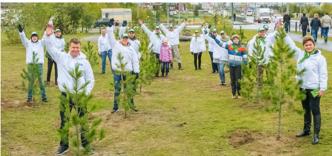
Мы уже посадили свое дерево, а вы?

Ирина РЕМЕС, Елена ЛАВРОВА