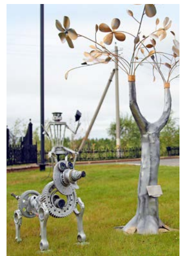
Наше «Чистое искусство»