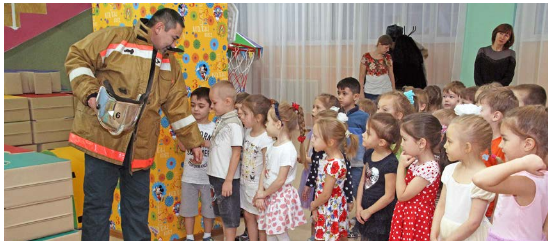
«Я б в пожарные пошел!»