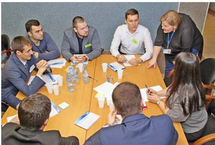
Участники «Школы резерва» готовы следовать собственной программе развития