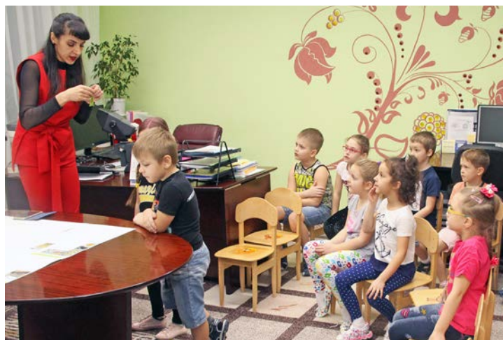
«Мастер-класс» по журналистике