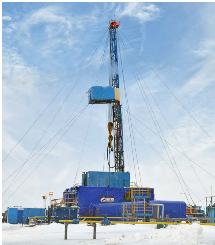
Скважина № 8820 стала одной из первых, восстановленных методом ЗБС в 2017 году

Перед тем как внедрить метод ЗБС, в Обществе был проведен комплексный анализ геолого-промысловой информации с учетом современных представлений о геологическом строении месторождений Уренгойского комплекса. На его основе были выбраны скважины-кандидаты с учетом следующих ключевых факторов: развитие и свойства пород-коллекторов по залежам пластов исследуемого разреза в рассматриваемой и соседней скважинах, положение газоки-костных контактов в межсква-