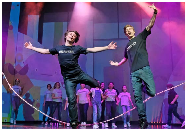
Артисты «Упсала-цирка» и солисты коллектива детей с ограниченными возможностями здоровья «Сюрприз» Дома детского творчества