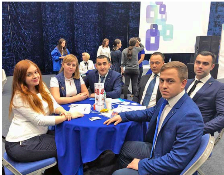
... а команда «Фальстарт», блеснув знаниями, вернулась домой из Ноябрьска с «серебром»