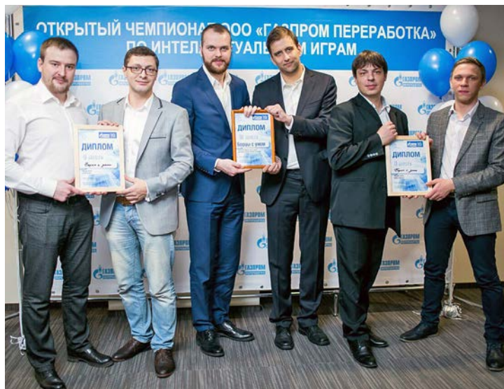
«Борцы с умом» «наиграли» на несколько призовых мест в Санкт-Петербурге...

Сергей ЗЯБРИН