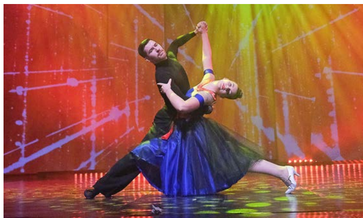
Романтичный и трогательный танец