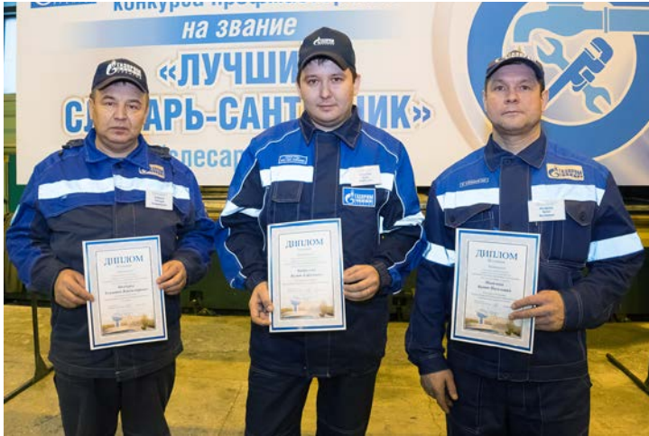
Награды – самым достойным!

В ООО «Газпром добыча Уренгой» прошел конкурс профессионального мастерства на звание «Лучший слесарь-сантехник (слесарь АВР)», в котором приняли участие представители четырех управлений Общества: по эксплуатации вахтовых поселков, материально-технического снабжения и комплектации, нефтегазодобывающего и Уренгойского газопромыслового управления.