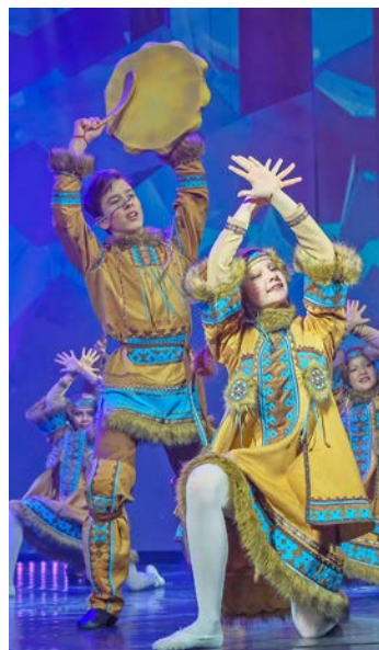
На сцене – образцовый ансамбль танца «Сюрприз» КСЦ «Газодобытчик»