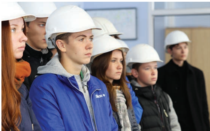
Экскурсия на промысел для участников проекта

В текущем году девять участников программы «Будущее вместе – Старт в профессию» трудоустроены в филиалы Общества «Газпром добыча Уренгой». Остальное – дальнейшее образование и развитие, профессиональный путь – зависит от самих ребят, от их стремления двигаться вперед и добиваться результатов.