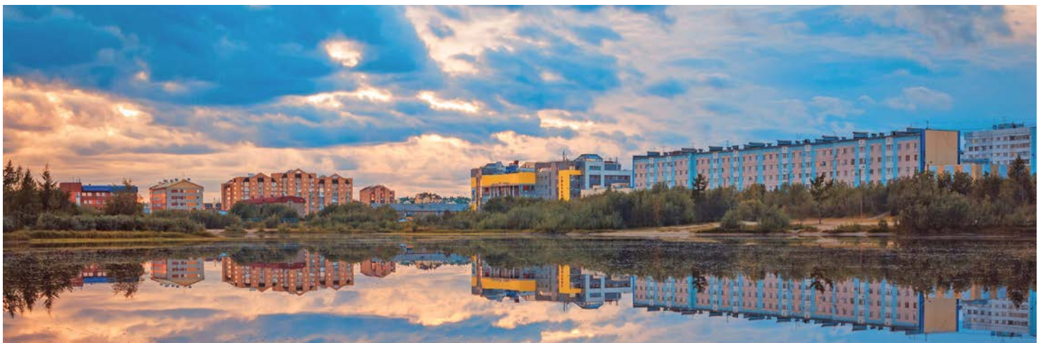
Не было печали, просто уходила осень...