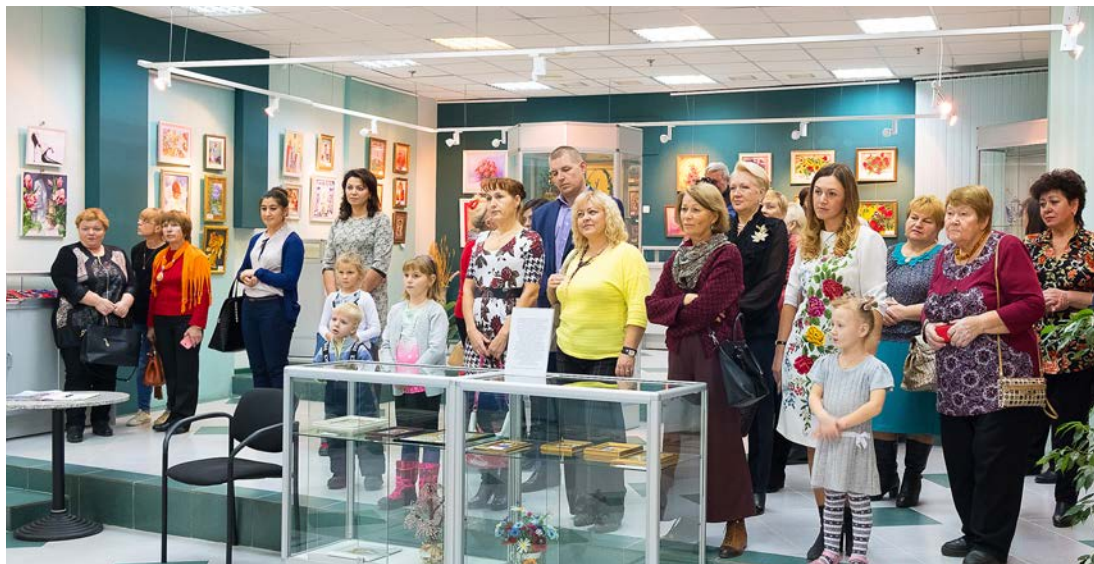
На открытии выставки, которая привлекла внимание жителей города разных возрастов