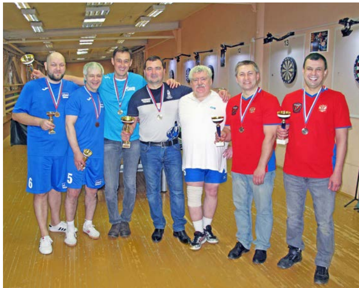
Спортивные соревнования дают возможность не только поддержать физическую форму, но и встретиться в неформальной обстановке

Турниры самых разных уровней проводятся на спортивных площадках Нового Уренгоя буквально каждую неделю. За звание лучших борются дошкольники и ветераны, профессиональные атлеты и начинающие спортсмены. В плотном рабочем графике время на соревнования находят и руководители предприятий и подразделений. Так, в Обществе «Газпром добыча Уренгой» уже более десяти лет проводятся Спартакиады среди руководства филиалов компании, начальников служб и отделов и освобожденных профсоюзных лидеров.