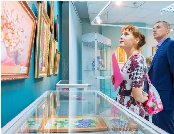
Картины новоуренгойских мастериц – настоящие произведения искусства