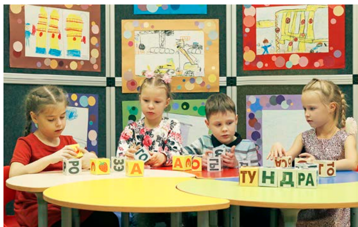
Обучение чтению с помощью кубиков Зайцева

Уже известна за пределами ЦЭР и театральная студия. Профессиональные педагоги знакомят ребят в возрасте от четырех до двенадцати лет с азами сценического мастерства. Юные служители Мельпомены пробуют свои