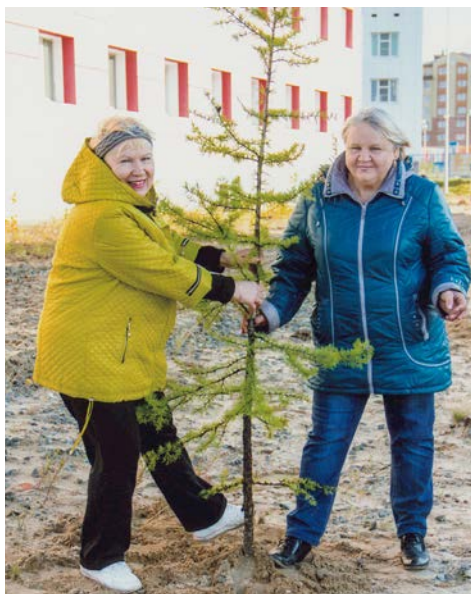
Давайте посадим дерево!