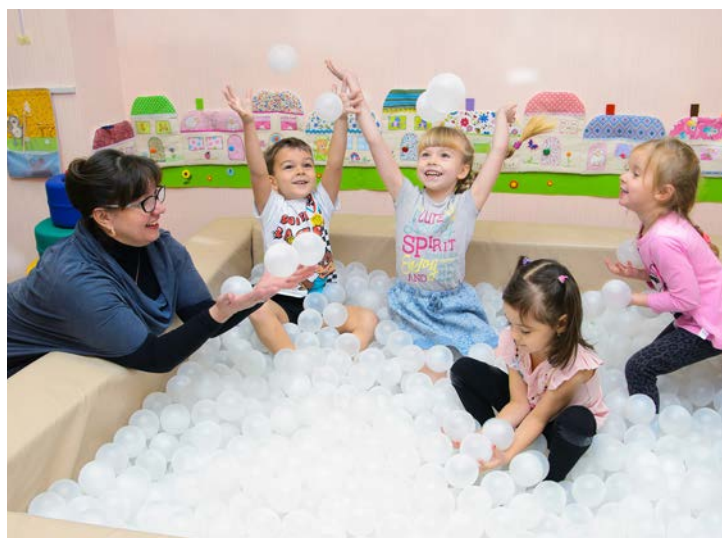
Северные дети играют в снежки не только зимой