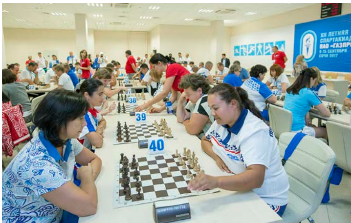
За шахматной доской