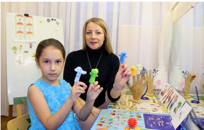
Сказка на пальцах. Урок по развитию речи