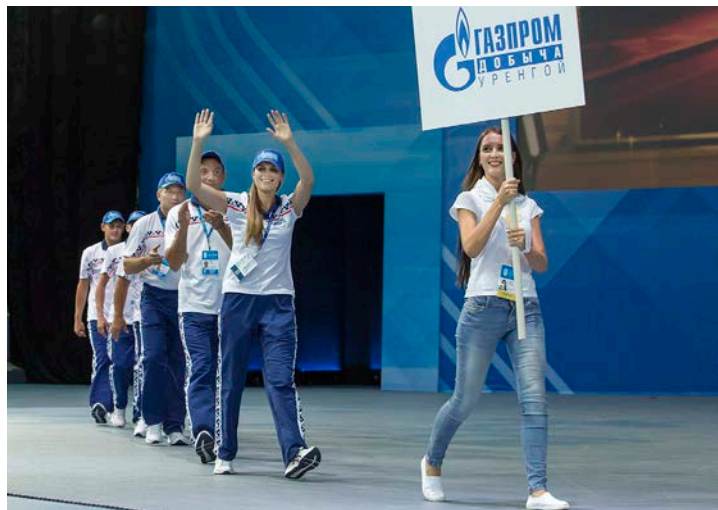
Команда Общества «Газпром добыча Уренгой» на церемонии открытия Спартакиады

С самого утра светило солнце. Светило усердно, испепеляюще. Оно работало, как часы, все восемь дней соревнований. Ни обещанного дождика в четверг, ни колыхания «сонного ручья». Одним словом, погода стояла летняя, жаркая, а посему и настроение было соответствующее. Проснулись участники команды в уютных номерах отеля «Имеретинский». Того самого, чьи стены еще помнят шумную многонациональную олимпийскую гвардию. Здесь потом так и говорили: из столицы зимних игр Сочи превратился в столицу летних. Итак, солнце, море, горы – все шептало, пело, кричало о том, что это – идеальное место для достижения максимальных рекордов.