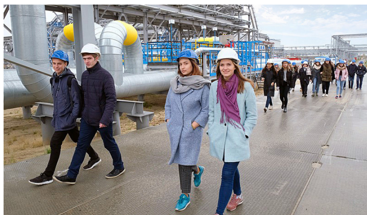
Экскурсия на газоконденсатный промысел 1А. Отсюда начинается путь голубого топлива в Европу

Реализация международного проекта началась в 2007 году, когда Новый Уренгой и Кассель в рамках соглашения о сотрудничестве стали городами-побратимами. Тогда же зародилась дружба учебных заведений: МБОУ Гимназии города Нового Уренгоя и Гимназии имени Фридриха города Касселя. Началось все с общения в режиме онлайн. А в 2008 году группа