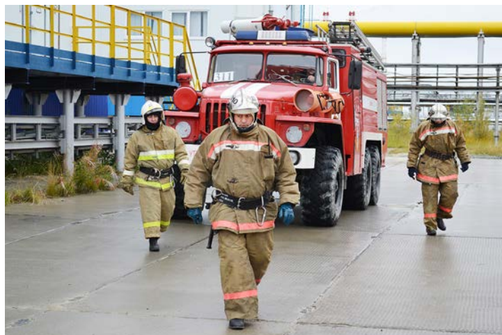
К счастью, пожарные в полном боевом облачении показываются на промыслах нечасто – только чтобы убедиться в исправности оборудования

На этот раз манометр показал, что давление водной струи было равно почти семи атмосферам. Этого вполне достаточно, чтобы