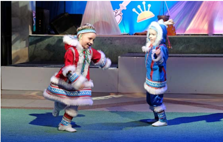
Каждый ребенок талантлив. Главное, раскрыть в нем потенциал и дать свободу выбора