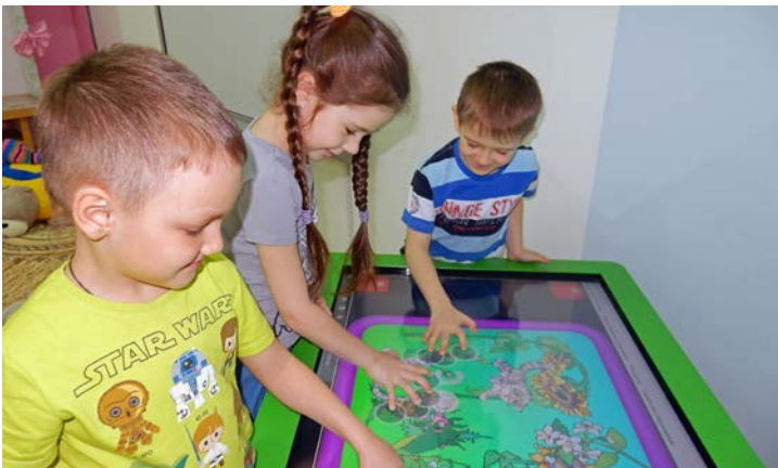
Хотим все знать!