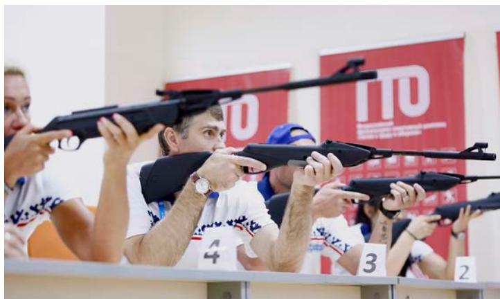
Готов к труду и обороне!

– У нас нет профессионалов, делегация состоит из сотрудников Общества, тех, кто до 18.00 работает, а потом тренируется. Тем не менее, вся команда упор-