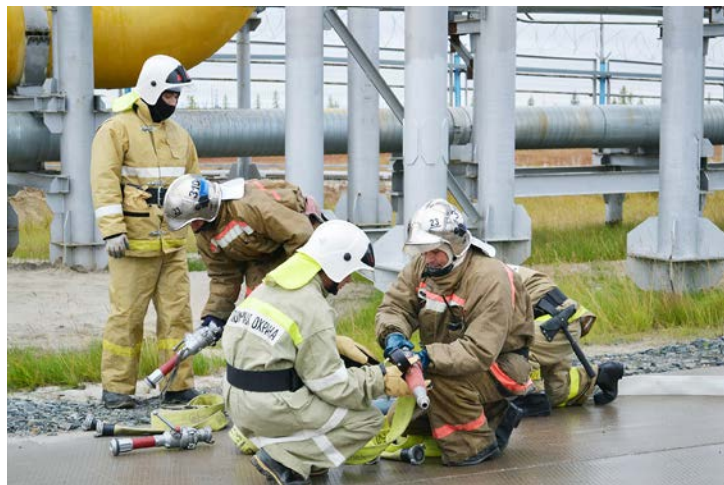
Все оборудование тщательно осматривается и проверяется профессиональными борцами с огнем совместно с добровольными пожарными дружинами