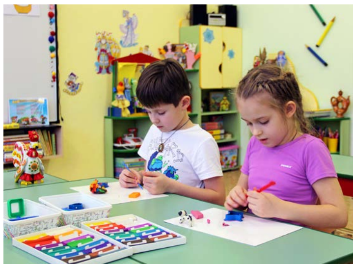
Лепим, творим, малюем...