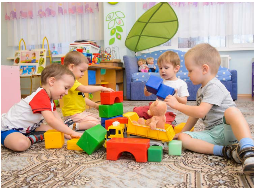
Развитие коммуникативных навыков в процессе игры

Также созданы новые условия в развивающей предметно-пространственной среде детских садов. С каждым годом повышаются качество и уровень образования, развития, воспитания дошкольника. Выпускники с успехом продолжают обучение в школе и учреждениях дополнительного образования, поэтому можно с уверенностью говорить о том, что коллектив УДП Общества «Газпром добыча Уренгой» успешно справляется со своей высокой миссией, предназначение которой – содействие развитию личности ребенка.