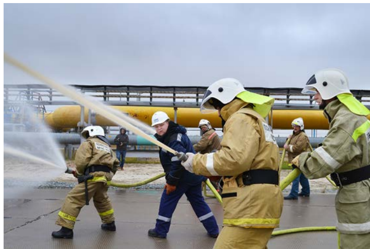
При давлении даже в семь атмосфер рукав удерживать не так просто, а ведь при необходимости давление может быть увеличено до одиннадцати атмосфер