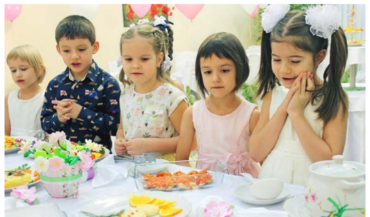
Что ни день, то праздник – дарит нам любимый садик!