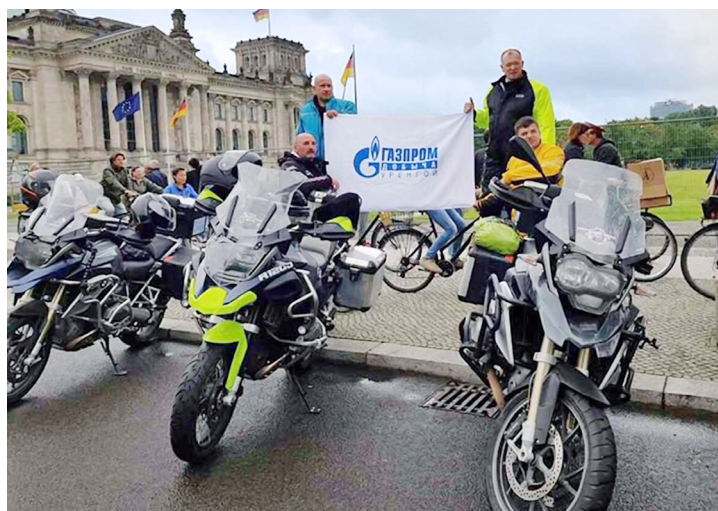
Наши в Берлине!