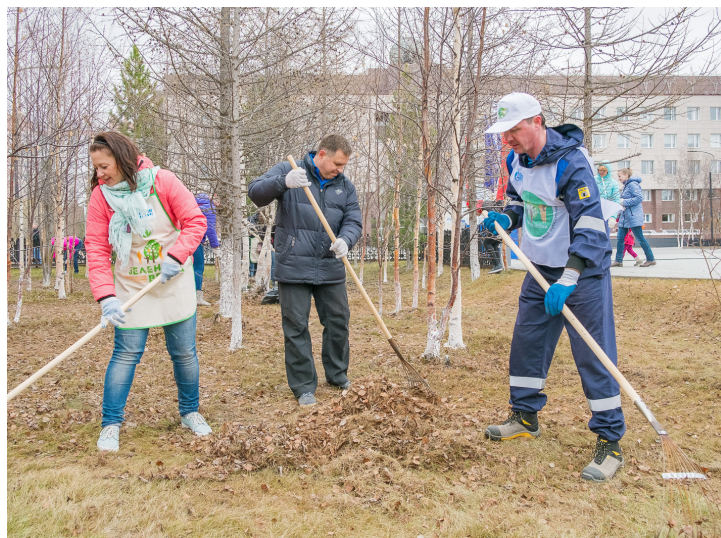
«Зеленая весна – 2017» объединила тысячи работников Общества

территория площадью порядка четырех гектаров, а городские полигоны отходов пополнились еще 150 кубометрами различного мусора.