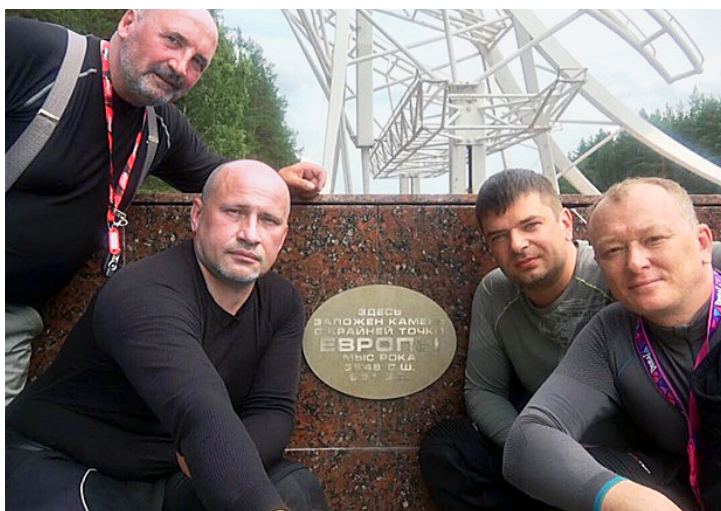
Здесь Европа встречается с Азией