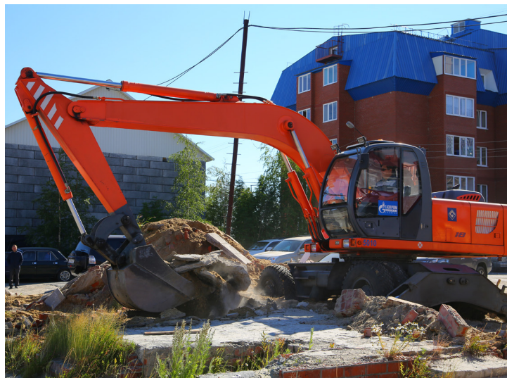
Усилия сотрудников предприятия были направлены и на благоустройство городских территорий

Силами работников предприятия также была убрана захламленная территория, прилегающая к цеху электроснабжения УГПУ в районе 105-й мехколонны. В работах приняли участие 40 представителей Уренгойского газопромыслового управления, а также задействованы машины Управления технологического транспорта и специальной техники. Их усилиями защищена