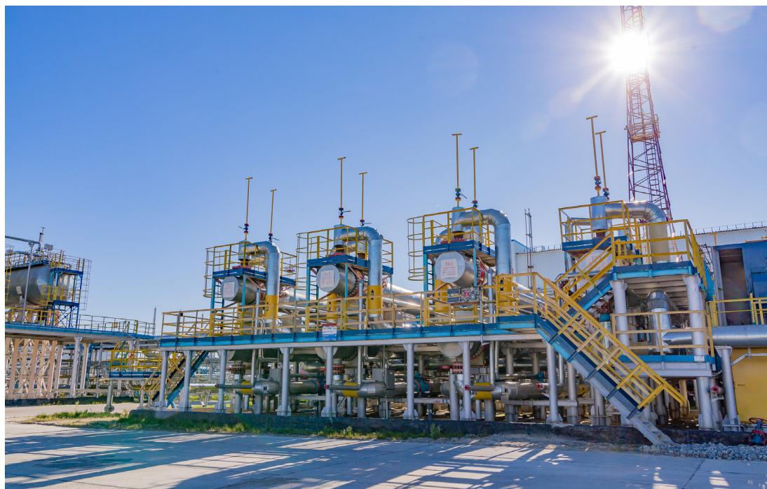
ГКП-22 Газопромыслового управления по разработке ачимовских отложений

Позже, уже в 2020 году планируется ввод трех устано-