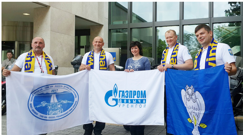
Путешественникам в Касселе был оказан самый радушный прием