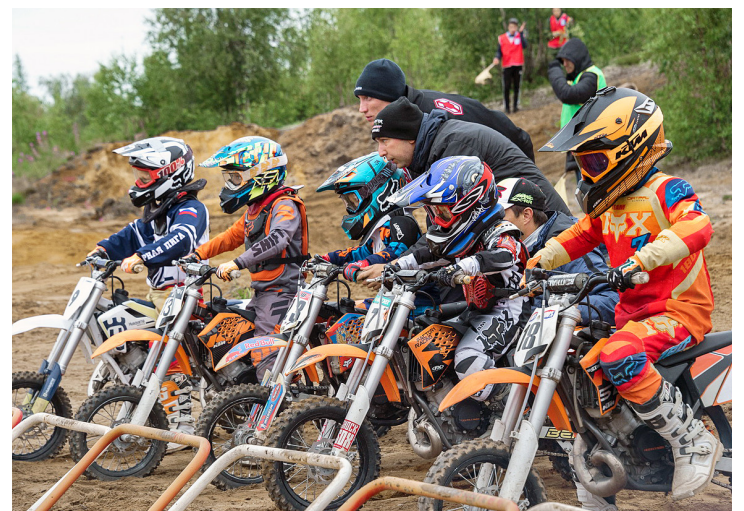
На старте – юные гонщики