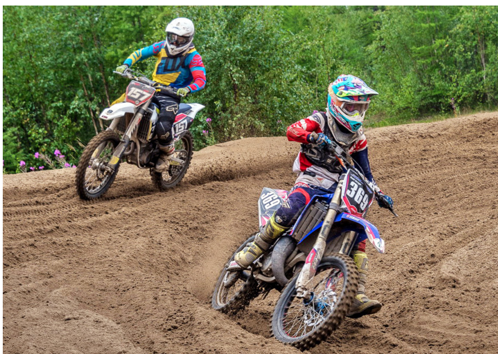
Новый поворот, и мотор ревет...