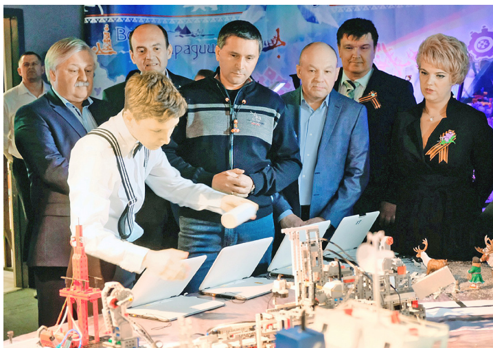
Новоуренгойские школьники демонстрируют гостям макет завода по переработке отходов

Проект реализуется в сотрудничестве с департаментом образования Нового Уренгоя и одобрен на уровне Министерства здравоохранения России. В Центре разместились отделения оказания медицинской помощи детям в образовательных учреждениях (детских садах и школах) и отделение медосмотров. А в ожидании приема посетители имеют возможность побывать в музее арктической медицины.